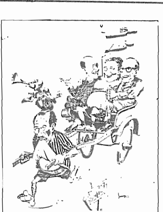
(امت، ۲۷ فروردین ماه ۱۳۵۹)

کشور عزیز و انقلابی مادر در شرایط خاصی قرار دارد. امپریالیسم جنایتکار آمریکا برای به شکست کشاندن انقلاب بزرگ ضد-امپریالیستی، دمکراتیک و خلقی ایران، توطئه های خود را تشدید کرده است. امپریالیسم جنایت پیشه آمریکا در این راه از همه امکانات خود استفاده میکند. از زرادخانه نظامی، سیاسی و تبلیغاتی خویش، از قطع مناسبات سیاسی و محاصره اقتصادی گرفته تا ارسال ناوگان دریائی به اقیانوس هند و خلیج فارس، از تحریک رژیم بعثی عراق و تجاوز به سرحدات ایران گرفته تا توطئه و دامن زدن به جنگ برادر کشی و انفجار لوله های نفتی و ایجاد تشنج در گوشه و کنار کشور.