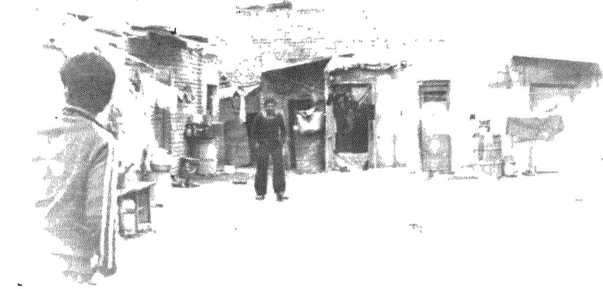
زحمتکشان ساکن شهرک ۱۷ شهریور در تنها گاراژ محله چندین آلوده ساخته اند.

● برای ۴۰ هزار نفر جمعیت شهرک هفده شهریور فقط یک درمانگاه وجود دارد، که آنهم بیشتر مواقع بسته است