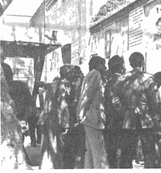
در سالگرد جمهوری اسلامی ایران، از طرف سازمان جوانان و دانشجویان دمکرات ایران در نیشابور، نمایشگاهی در مورد سیر انقلاب ایران ترتیب یافت. این نمایشگاه که بمدت سه روز ادامه داشت، با استقبال وسیع مردم روبرو گردید.