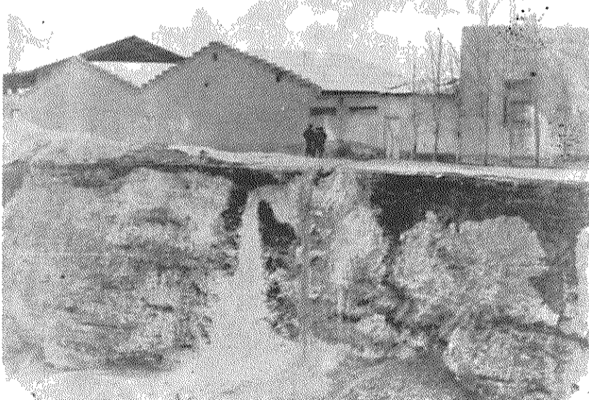
سودجویان برای بدست آوردن ماسه گودال های عمیق در شهرک ۱۷ شهریور حفر کرده‌اند.

مجموعه دیگری از فقر و محرومیت‌های شهرک را در نقطه‌ای دیگر مشاهده می‌کنیم. وارد محلی می‌شویم که قبلاً بعنوان کاروانسرا استفاده می‌شده، ولی اکنون بسا