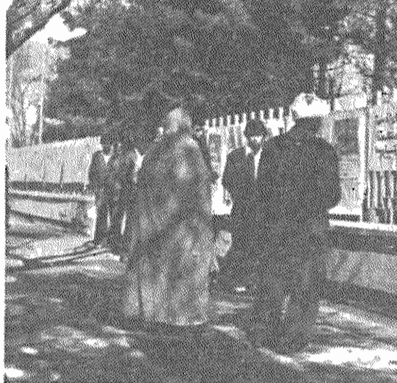
از طرف هواداران حزب توده ایران در نیشابور نمایشگاهی از جنایات امپریالیسم آمریکا در این شهر ترتیب یافت. این نمایشگاه که چند روز ادامه داشت، مورد استقبال زحمتمکشان این شهر قرار گرفت.