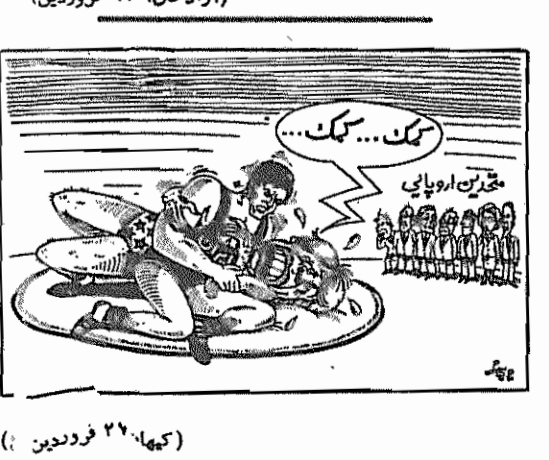
(کعبه، ۲۶ فروردین)