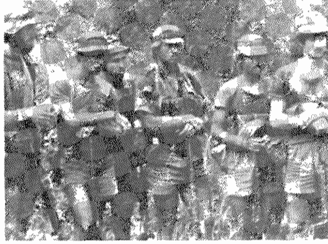
سرباران اجیر حکومت نژادپرستان «رودزیا»، که برخی از آنها دارای «تجربه وینام» اند

صنایع استخراجی زیمبابوه در رسماً تمام سرزمین خارجی: انگلیسی، آلمانی، بریتانیایی، دانلوپ، استاندارد، بک، برکتلیز بانک، آفریقای جنوبی، اسپانیایی، آمریکائی (یونیون کارباید) و آلمان غربی (آ.ا.گ تلفونکن، ریمنس) قرار دارد. انحصارگران نامبرده دو سوم تولید صنایع استخراجی را در دست دارند. دستزد کارگران سیاهپوست معمولاً براب کمتر از هفتاد درصد سفیدپوستان است. برای نمونه، این اختلاف در معدن کرم، نیکل و مس بیش از ۹۳ درصد، یعنی دستزد سیاهپوستان این معدن، کمتر از ۷ درصد دستزد سفیدپوستان بود.