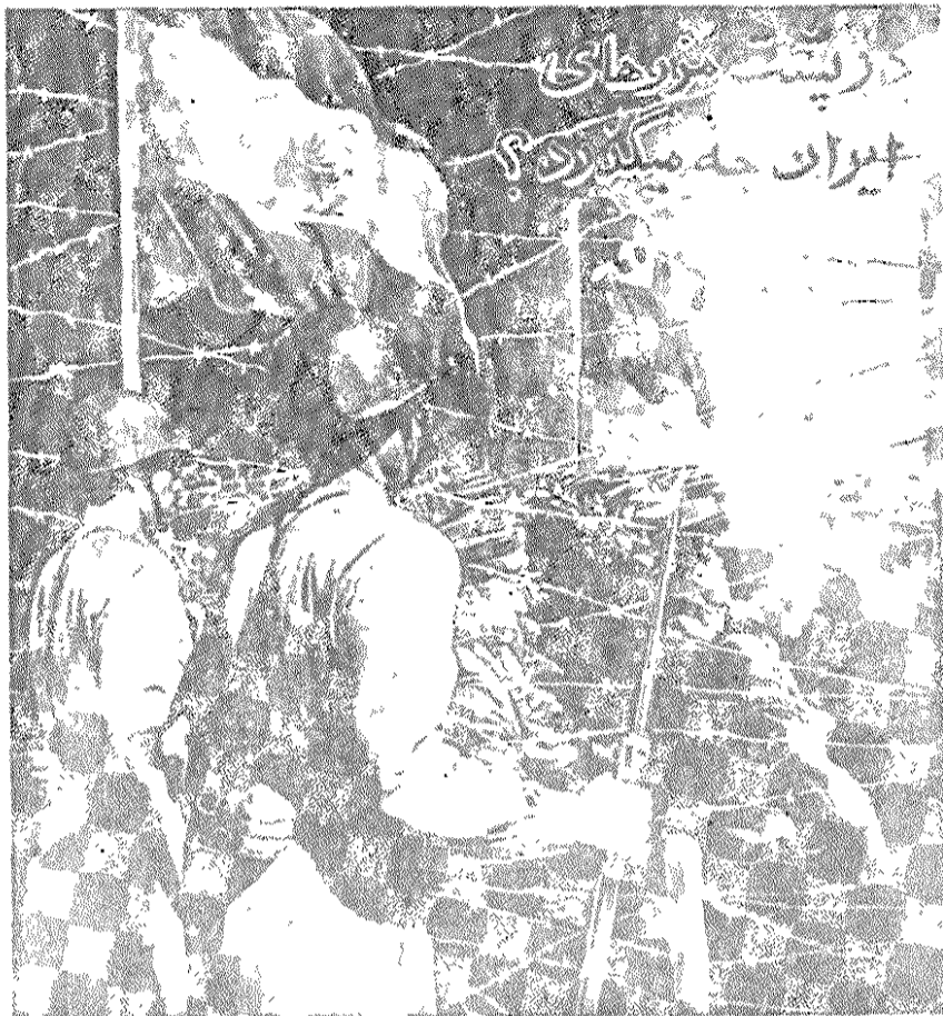
تهران مصور در مهرماه ۳۱ از آمریکا خبری نیست، «خطر» از جانب شوروی است!

شماره ۲۱۲ - سال دوم - دوره هفتم - تابستان ۱۳۵۹