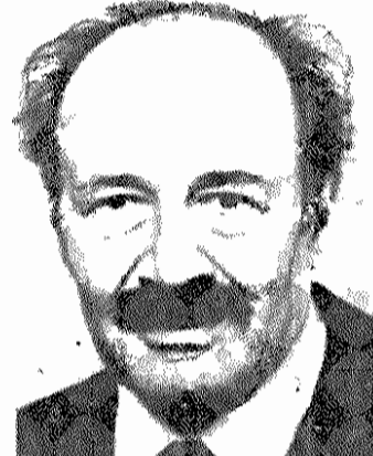
د. امرودم در چارچوب این اظهارات امام خمینی، که گفته اند ما با هر دولتی که به حقوق ما احترام بگذارد و ما دوستی کنیم، دوست هستیم و با هر کرد، ماساژ، نشرقی، نشرغری، بقیه در صفحه ۲

مردم ایران باید بتوانند در زمینه های سیاسی، اقتصادی، نظامی و فرهنگی، بدون وابستگی، به هیچ قدرت خارجی، آنچه را که صلاح خود می بینند، تصمیم بگیرند و عملی سازند.