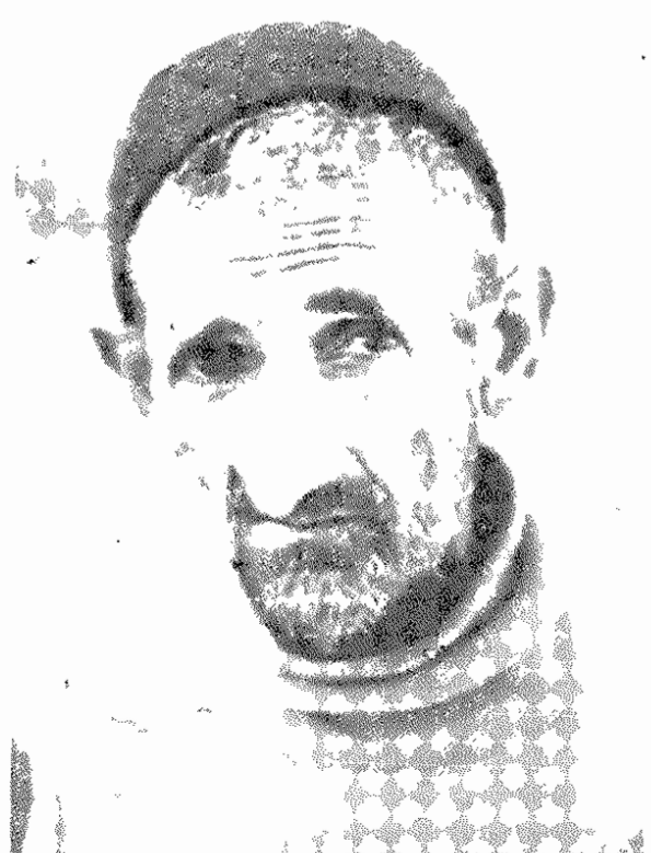
دهقانی از دره الموت، یک عمر چشم انتظار زمین و عدالت

پل ارتباطی (!) روستا با شهر. که بارها شاهد حوادث ناگوار بوده (روستای گرمستان، ساری)