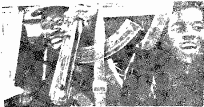
افراد وابسته به ارتش آزادیبخش خلق زیمبابوه

شیرازه‌های اقتصاد زیمبابوه را در سال‌های گذشته، هرچه بیشتر، از هم پاشید. بسیاری از زمینداران بزرگ، کاردان سفیدپوست بخارج گریختند و کسرتن‌های بزرگ امپریالیستی سرمایه‌گذاری خود کاستند. فنون بر این، سادگی سلاح‌های خلق و سرکوب وحشیانه آنان از سوی رژیم، به ویرانی جاده‌ها، پل‌ها، بیمارستانها، مدارس و آبادیهای بیشتر منجر شد.