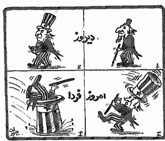
(آزادگان، ۳۰ فروردین ۱۳۵۶)

کمکهای مالی غرب برای اقتصاد ورشکسته مصر به منزله اکسیژن برای بیمار در حال مرگ می باشد. (جمهوری اسلامی، ۲۵ فروردین)