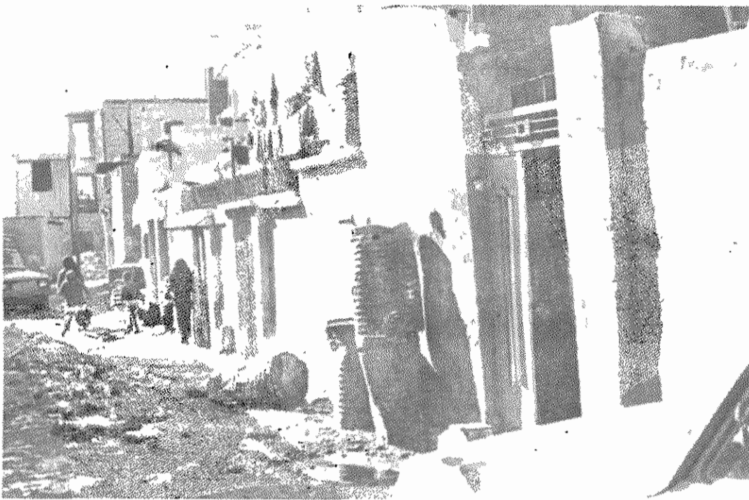
یکی از کوچه‌های هادی آباد، تنها چیزی که نیست «آباد»