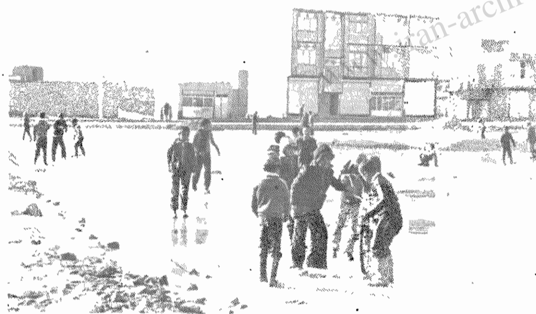
بچه‌ها در لای ولجن و در فضایی که آکنده از بوی گند است، بازی میکنند