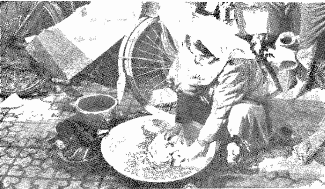
آب هم در هادی آباد پیدا نمی‌شود. زنان زحمتکش آن برای شستن یک تکه لباس هم با مشکل روبرو هستند