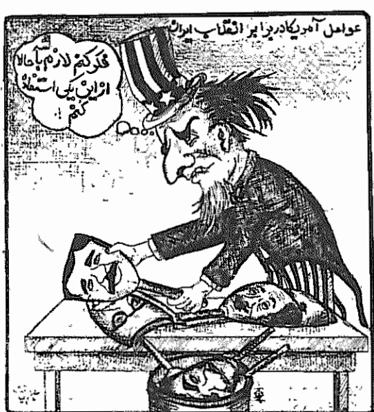
عوامل آمریکا در برابر انقلاب ایران