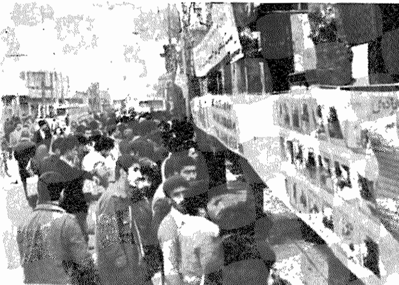
نمایشگاه گام‌های انقلاب توسط هواداران حزب توده ایران در سباهکل برگزار گردید. این نمایشگاه، که مدت سه‌روز ادامه داشت، مورد توجه زحمکشان سباهکل قرار گرفت.