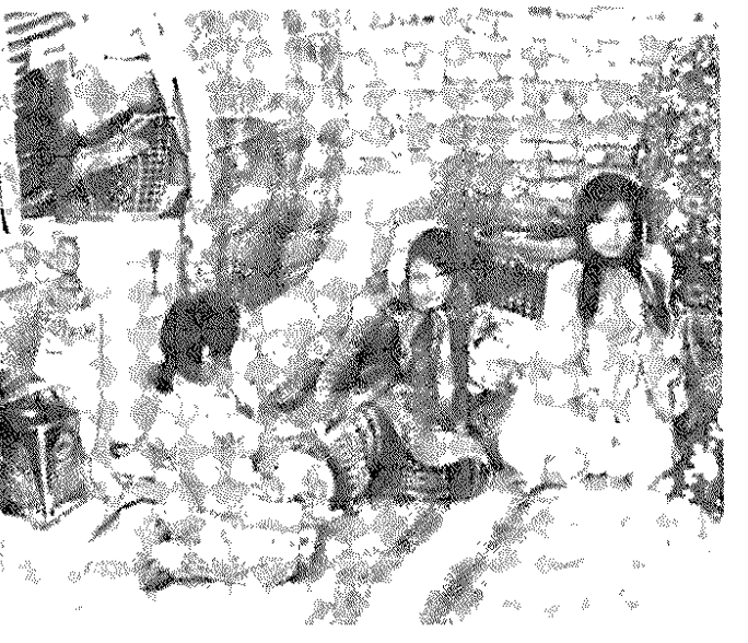
کودکان زحمتکشان ایران در چنین خرابه هایی زندگی میکنند. دوشکه ای که در سمت چپ عکس می بینید، یکی از ستونهای است که سقف را روی خود نگه داشته است.

وارد یکی دیگر از آلونکها میشود که یازده نفر در آن زندگی میکنند. در نگاه اول دوشکه توخالی، که روی هم گذاشته اند تا حایل سقف باشند، جلب نظر میکند. بر اختیار در زدن ستونهای سرساخته های نوکران، میریالیس را می خاطر می آید. صاحب آلونک ما را به نشستن دعوت میکند. از زندگیش می پرسیم. میگوید: