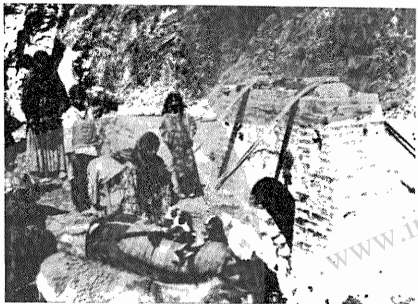
روستاها جاده ندارند، پل ندارند.

در اینجاست که ورود و خروج روستائیان در زندگی دیگری در دسترس کار و زندگی صیفی کاران فراهم می‌سازد. صیفی کاران به توزیع کنندگان قدرت مند تره بار در میادین بزرگ شهرها و یا به عبارتی سلف خران یا پیش خریداران وابسته میشوند. توزیع کنندگان و واسطه‌ها از فقر صیفی کاران سوءاستفاده میکنند و تا آنجا که ممکن است قیمت کالاهای تولید شده توسط این دهقانان را پائین نگاه میدارند و محصولات صیفی کار را در واقع به بهای ناچیزی خریداری میکنند. بدین سان صیفی کاران تحت استثمار مضاعف، نیروی کار خود را به بهای بسیار ارزان در اختیار مالکان بزرگ و واسطه‌ها قرار میدهند. این دو گروه غارتگران ما نند دو سوی یک سکه دهقانان زحمتکش صیفی کار را در فشار قرار میدهند.