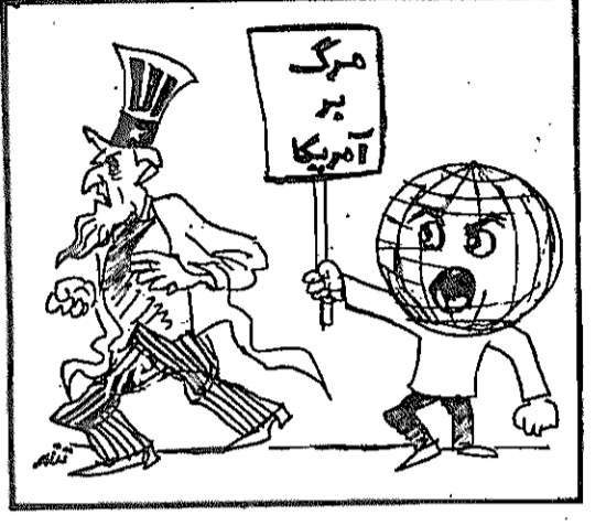
(کیهان، ۲۴ فروردین ۱۳۵۹)

طی دیروز و امروزی و روزهای آینده و اقشار مختلفی از مردم ملی تناسهای تلفنی متعدد به کیهان اذکافات و مسئولین کشور بوژه زهر عالیقدر انقلاب، امام امت، مصرا نه درخواست کردند که از تحویل اجساد کماندوهای مزدور و مهاجم امپریالیسم به دولت متجاوز آمریکا اکیدا خودداری شود. آنها غالبا میگویند، تحویل اجساد به آمریکا خوراک تازه ای برای تبلیغات علیه ایران، برانگیختن احساسات مردم آمریکا و افتخار عمومی در مراسم تشییع جنازه آنها و شهیدسازی (که اخیرا هم کارت به آن تصریح کرده است) خواهد بود. مردم پیشنهاد میکنند که اجساد این مزدوران کثیف در نقطه خاصی چه در همان منطقه کوپور و چه در منطقه دیگری از تهران سدفن شده و پروزی آن بنائی سبلیک بمباران «گورستان امپریالیسم» ساخته شود. تا بنای مزبور هم تجسم نفرت و کینه مستمر ملت ایران علیه چهار تواران و مستکبرین بین المللی بوده و هم برای سلهای آینه ایران نشانی از وضعیت فعلی مسا در سمنه مبارزه قهرمانانه ملت ایران علیه آمریکا باشد. (کیهان ۷ اردیبهشت)