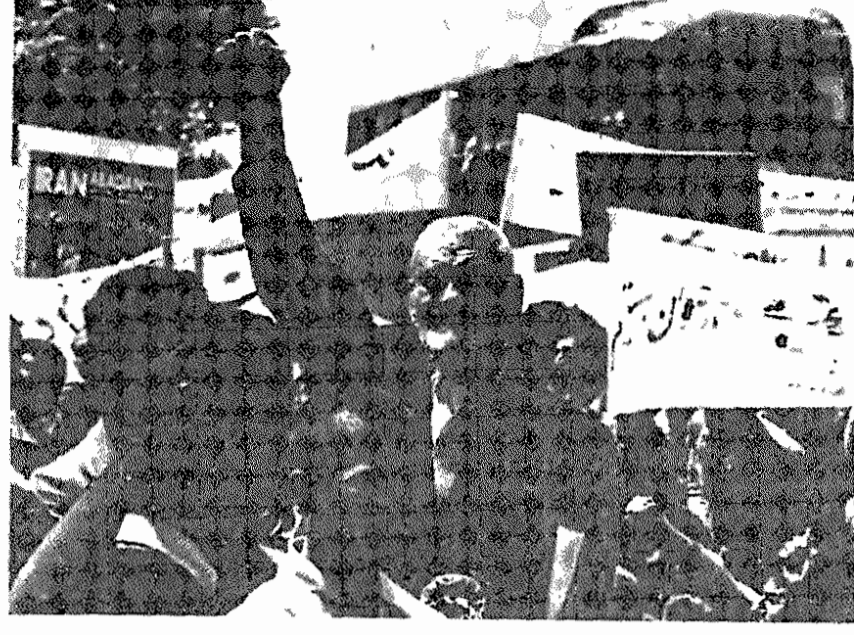
تظاهرات در نخستین اول ماه مه پس از پیروزی انقلاب (۱۳۵۸/۲/۱۱) در تهران

آی بردگان بیخاسته آهای برنجکاران خسته تفتکاران صحرا جنگجویان عرب و شما رققای محروم کشورهای ستم و سرمایه اینک ببینید اینجا در ایران که چگونه قلبم را شقه میکنند تا هر تکه آنرا جداگانه اعدام کنند آری ببینیدم که چگونه در این روز اول ماه مه در کوششی دردناک قلبم را گردآوری میکنم تا با این پرچم خونین در دست و در جیبهای متحد سپاه کار را بر صف سرمایه پیروز گردانم.