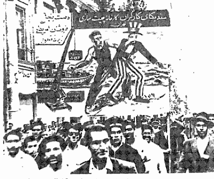
یکی از تظاهرات اول ماه مه قبل از ۲۸ مرداد ۱۳۳۲