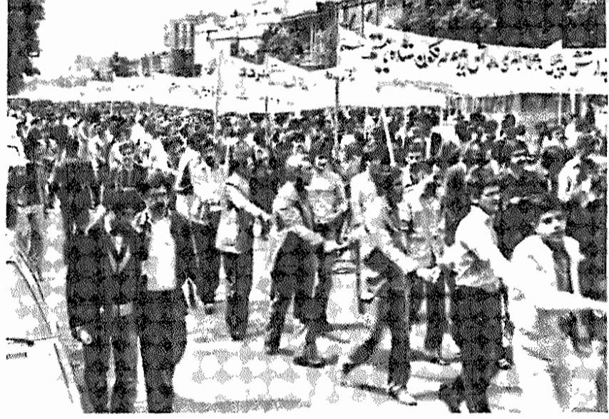
تظاهرات در نخستین اول ماه مه پس از پیروزی انقلاب (۱۳۵۸/۲/۱۱) در تهران

ایران قرار میدهند، بیش از پیش مورد تأیید کارگران قرار بگیرد. کارگران گرایش قویتری به عضویت در حزب توده ایران نشان میدهند که علام آن بارز و متعدد است. حزب توده ایران و طبقه کارگر ایران از هم جدا نیستند. علیرغم تلاش امپریالیسم، ارتجاع و ضد انقلاب داخلی، دیوارهای مصنوعی ایجاد شده بین حزب توده ایران و طبقه کارگر بیش از پیش درهم فرو میریزد و حزب و طبقه کارگر ایران بیش از پیش به استقبال هم میروند. در اینکه این روند رفته رفته فراگیرتر خواهد شد، کوچکترین شک نیست. نمیتوان داشت و به همین جهت حزب بحق به آینده با خوش بینی بینگردد، همانطور که نسبت به دوام و پیروزی انقلاب، کترین شک و تردید ندارد. با در نظر گرفتن کلیه جهات یاد شده است که به درستی در شمارهای کمیته مرکزی حزب توده ایران، به مناسبت جشن کارگری اول ماه مه، از کارگران ایران دعوت بعمل آمده است: کارگران ایران! در سلامهای صحنی (سندیکا) - (اتحادیه) و حزب سیاسی خود، حزب توده ایران مشتاقان شوی! بمن است که کارگران ایران به حزب خود، حزب توده ایران، پاسخ مثبت خواهند داد و تشکل صحنی و سیاسی طبقه خود را تسریع خواهند کرد.