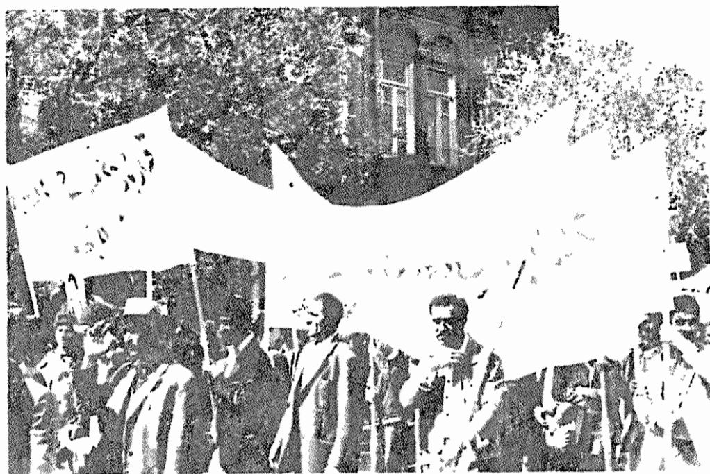
تظاهرات در نخستین اول ماه مه پس از پیروزی انقلاب (۱۳۵۸/۲/۱۱) در تبریز