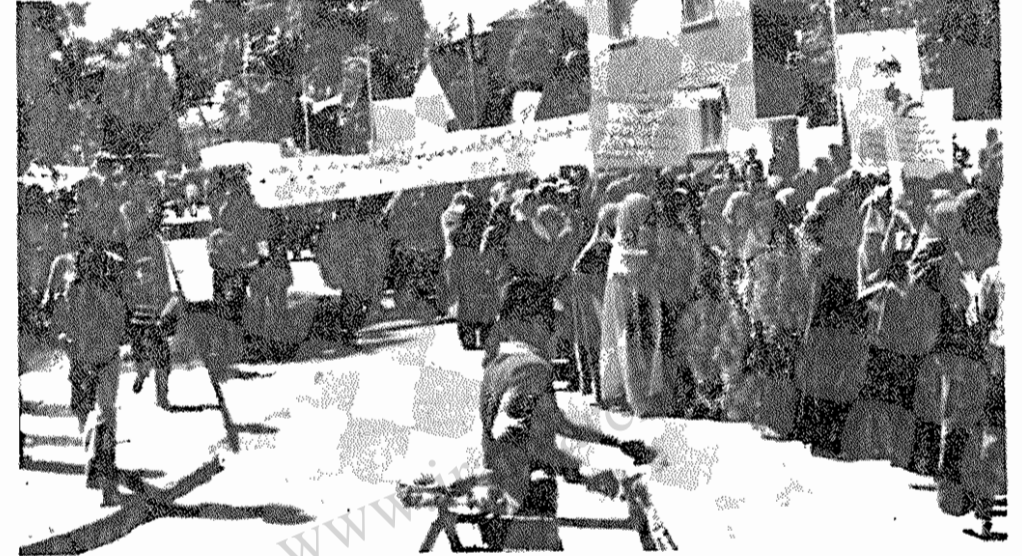
تظاهرات در نخستین اول ماه مه پس از پیروزی انقلاب (۱۳۵۸/۲/۱۱) در قاهمشهر

تشکل ۵ تا ۶ میلیون نفر کارگر و زحمتکش ایران در انجمن های صنفی (سندیکاها و اتحادیه ها) ضرورت تأخیر ناپذیر انقلاب ایران است. تثبیت پیروزی انقلاب، تأمین خواسته های رفاهی کارگران و برخورداری طبقه کارگر از فعالیت سیاسی در مرحله کنونی حصول جامعه انقلابی ایران، از جمله در گرو چنین تشکلی است.