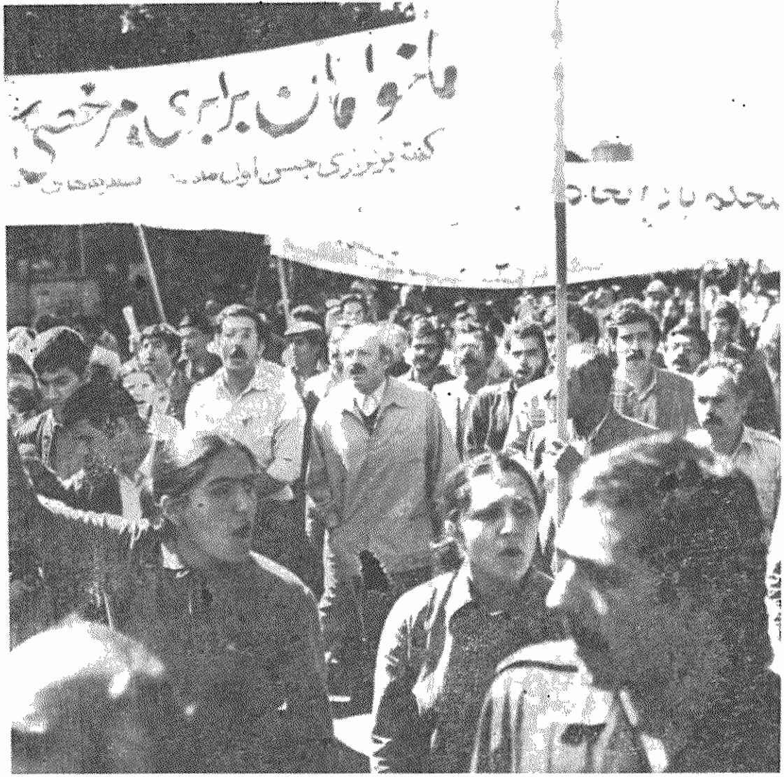
رفیق نورالدین کیانوری، دبیر اول کمیته مرکزی حزب توده ایران در راهپیمایی روز جهانی کارگر

در دستهای پیسته، اما بی توان نشان پلاکاردهایی به چشم می خورد که با هر نسیم محکامی موج بر میدارند. اهم این پلاکاردها چنین است: