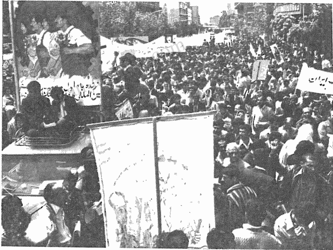
کارگران و زحمتکشان ایران در روز جهانی کارگر، برای مبارزه با امپریالیسم، بسر کردگی امپریالیسم آمریکا و دفاع از انقلاب، استقلال و آزادی ایران تجدید پیمان کردند

زلیق نورالدین کیانوری، دبیر اول کمیته مرکزی حزب توده ایران و عده ای از اعضای رهبری حزب نیز در راهپیمائی روز همستگی جهانی کارگران شرکت کردند.