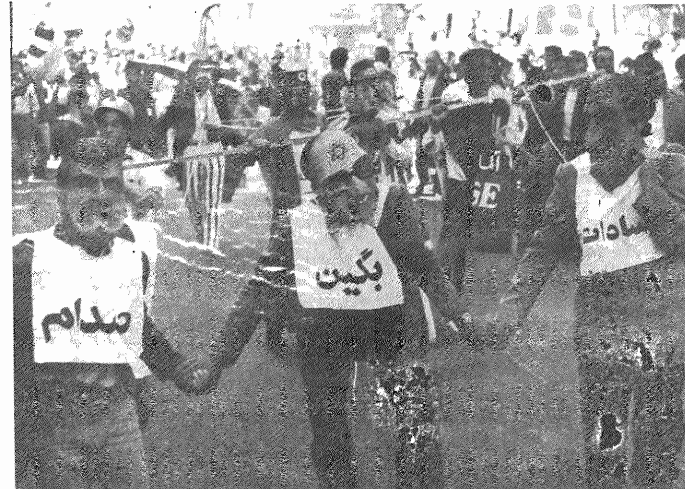
کارناوال درباره امپریالیسم آمریکا و دستیارانش