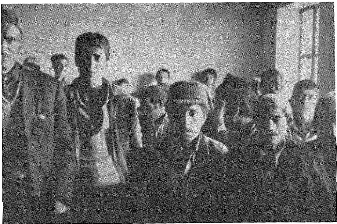
ده علی اکبر - کرمانشاه - دهستان درو فر امان اهالی در مدرسه جمع شده اند تادرباره مسائل خودشان بحث کنند