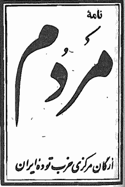
دوره هفتم، سال دوم، شماره ۲۲۵ پخش ۱۴ اردیبهشت ۱۳۵۹ - تک شماره ۱۵ ریال

امپریالیسم آمریکا و کلیه متحدانش از امپریالیستهای اروپائی گرفته تا دولت‌های وابسته ضد مردمی چون مصر و عمان و پاکستان و عراق و عربستان و ترکیه و... با تمام قوا قصد انهدام انقلاب ایران و دستاورد های آنرا دارند. این حقیقتی است که خوشبختانه اکنون کسی در آن تردید ندارد و همگان، حتی عالیترین مسئولین جمهوری اسلامی ایران نیز بر آن تاکید کرده اند.