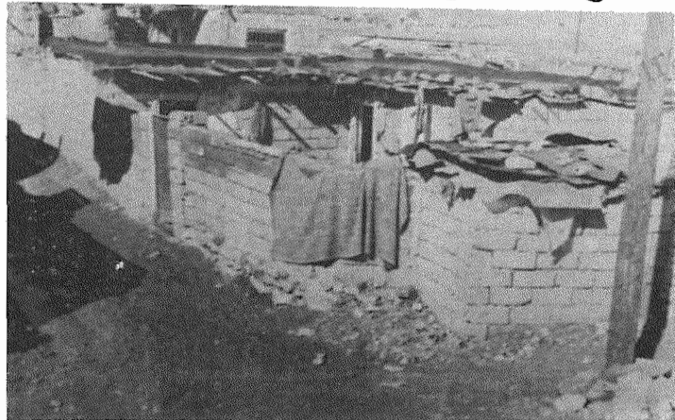
شیراز کوخ نشینان!