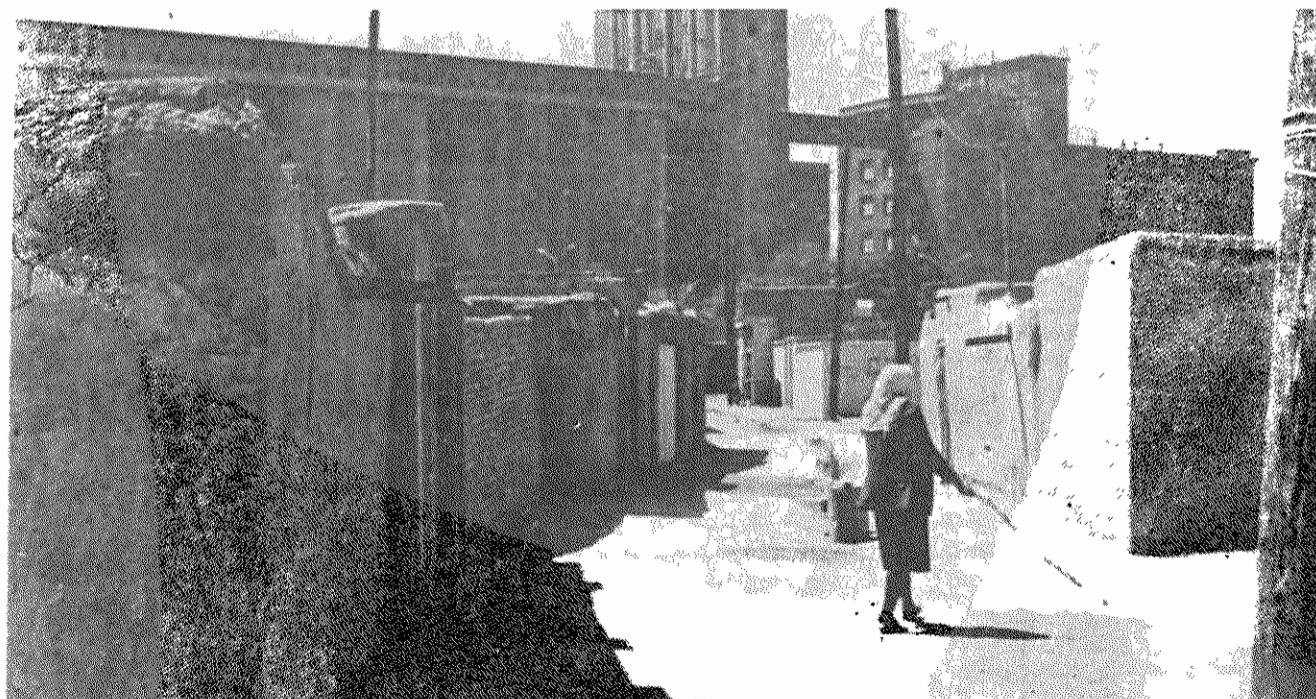
ترک آباد پشت سیلواست، با سرورولی بهتر از محلات فقردیگر، اما با همان مشکلات و کمبودها

بیایید باهم سفری کوتاه به قلبهای دردمند انسانهای محروم، اما امیدوار محله ترک آباد بکنیم: در تاب شتاب آلود کوچه پهنی که در انتها به برزنی دیگر راه دارد، چند زن دور گونی پروصه‌های نشسته و گردکوت سبزی گندیده‌های حلقه زده‌اند و در عین اینکه سخت مشغول کارند،