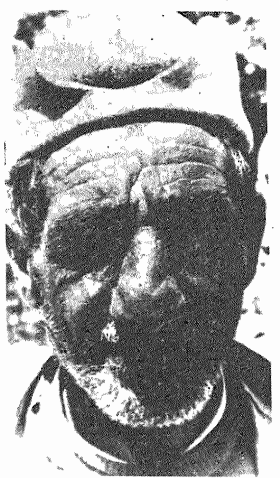
دهقان ایرانی یک دنیا رنج و غم پشت سر نهاده ولی به آینده آزاد و زندگی بهتر چشم میدارد