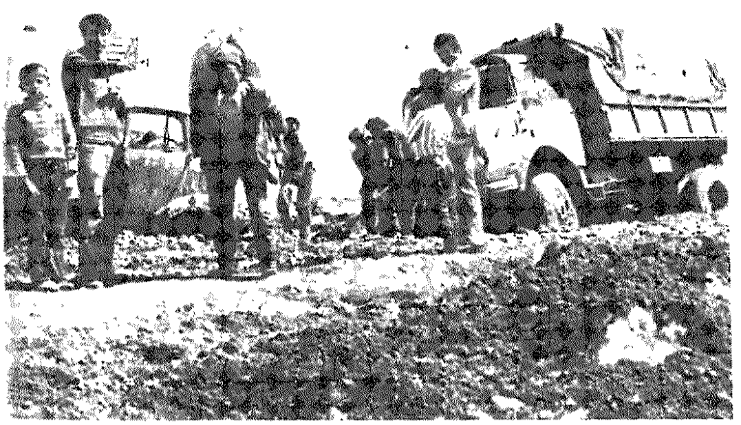
جاده های روستائی - اگر چنین چیزی وجود داشته باشد اغلب خرابند و وسایل نقلیه به گل می نشینند. احداث و تعمیر راههای فرعی روستائی اهمیت فراوان دارد

فرماندار محترم و قشمبر، ترکی به روزنامه روزگار نامه «مردم» تقدیم میکنم. محترما عرض میدارم، آب مصرفی مردم روستای چالی شیرگاه فقط از آب تبری که از وسط منازل شهر شیرگاه میکشند، تا بنین میکشند این منازل نسبتا آلیسه و ظروف کثیف حتی کهنه اطفال خوردن در آن میشوند، بلکه در بعضی موارد توالن منزل خود را روی آن نرس پنا نموده اند. اهالی روستای چالی چندین بار به شهرداری شیرگاه مراجعه نموده اند، ولی شهردار می گوید اعتبار نداریم که روی نرس را بپوشانیم و غیره. روستای چالی چندماه قبل جهت تامین آب آشامیدنی لوله کشی شده، ولی از وجود آب خبری نیست. مردم این روستا نسبت به جمعیتی که دارد، بخاطر استفاده از آب تهر مزبور بیش از هر جای دیگر بیمار میشوند و کسی نیست که به تقاضای مکرر آنان توجه نماید. استدعا است بخاطر حفظ سلامتی مردم این روستا وسرایت بیماریهای واگیری و غیره به نقاط اطراف، هرچه