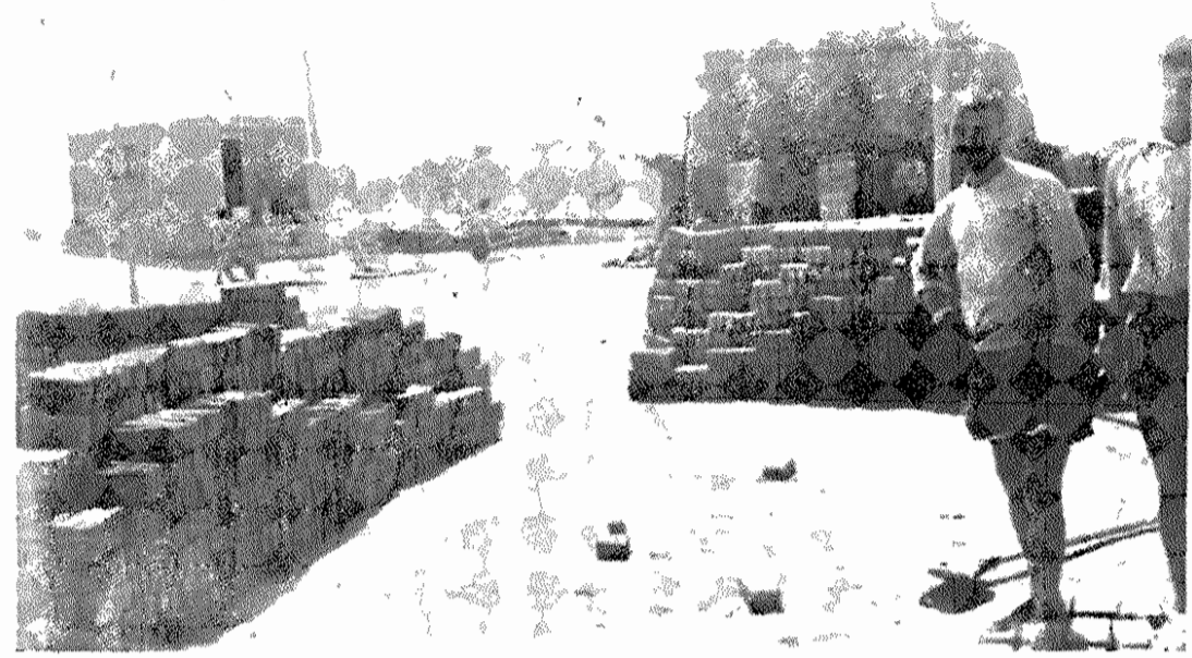
کارگران کوره پز خانه های قم میگویند:

مطلب کوتاهی که در زیر می خوانیم، گزارشگر است دربرگیرنده مشکلات و خواسته های کارخانه لپه پاک کنی (تندم) که بوسیله یکی از دانش آموزان هوادار حزب توده ایران در تقعه تهیه شده است. همراه با دانش آموزان همکلاسی ام برای سازید به کارخانه لپه سازی رفته بودیم. آنجا کارگران در اتاقهای تاریک و پر گردوغبار مشغول کار بودند. رفیق پیش آن ها. می خواستیم ببینیم وضع زندگی شان چگونه است؛ چقدر مزد می گیرند، آیا آن اندازه هست که کفاف مخارج زندگی خانوادگیشان را بکنند؛ به یک کارگر نزدیک شدیم. گفتیم: خسته نباشید. گفته خیلی ممنون. پرسیدیم: چقدر دستمزد می گیرید؟ گفته: ماهی ۶۰ تا ۴۰ تومان در روز دستمزد داریم. در هفته جمعه ها تعطیل است و روزهای پنجشنبه هم کارگران نصف روز کار می کنند... ولی کارگران وسط حرفش دویزدند که... در دست نیست! اولاً که هیچ تعطیلی ندارند. ثانیاً کارما روزانه است و حقوق هر روزانه، هر وقت تعطیل شد، کارکنانیم یارماً تعطیل بود، یا بهره علت دیگر، سر کار نبودیم، پولی در کار نیست. شما که که سواد دارید، می دانید قانون جنگل یعنی چه؟ از ساعت ۶ صبح الی ۸ بعد از ظهر. تعطیل هر ای خوردن غذا است احتیاج داریم. از سر کارگن پرسیدیم: این همه گرد و خاک و آشغال که اینجا همه جا هست، برای سلامتی کارگران مضر نیست؟ جواب می دهند: - اصلاً! خاکها از ماشین درمی آید و هیچ کارهم نمی شود کرد! - کارگران چند ساعت در روز کار می کنند؟ - از ساعت ۸ صبح کار شروع می شود. نه خیر. هر روز کار کنیم، مزد می گیریم. اگر کارکنیم نه. - بیمه هستید؟ - خیر. - پس اگر مرض شوید و نتوانید