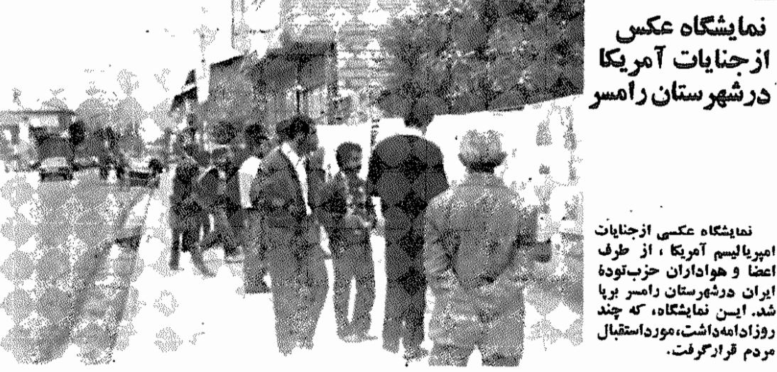
نمایشگاه عکسی از جنایات آمریکا در شهرستان رامسر

۴ ساعت کار در هفته، دستمزد مساوی در برابر کار مساوی، شمول قانون کار بر کلیه کارگران، قدغن ساختن کار اطفال کمتر از ۱۵ سال، رعایت حقوق زنان کارگر و جوانان، بیمه بیکاری و بیمه های اجتماعی، تأمین مسکن، بهداشت و آموزش رایگان از خواسته های مبرم رفاهی طبقه کارگر ایران است ادامه بیکاری در سطح کشور ضربات سنگینی به طبقه کارگر ایران وارد می آورد. با ایجاد کار در همه زمینهای توسعه اقتصادی - اجتماعی هر چه زودتر بیکاری را از بین بردارید کارگران را در تدوین قانون مترقی کار، بیمه های اجتماعی و دیگر مقررات کارگری و نظارت بر اجرای قوانین کار و بیمه شرکت دهید