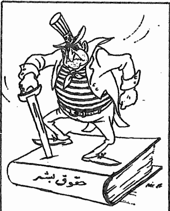
امریکا: هیچ کشوری مثل ما از حقوق بشر دفاع نمی کند. هم اکنون برای دفاع قاطع از حقوق بشومجبور شدیم نیروی فراوانی در کره جنوبی پیاده کنیم. توجه میفرمایید که...!