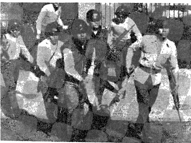
سربازان مزدور رژیم دست نشانده السالوادور با مبارزان خلق زفتاری وحشیانه دارند.

شقیق خورگه هندل، دبیر کل حزب کمونیست السالوادور، چندی پیش در مصاحبه ای با خبرنگاری «پرسنالیتیا» درباره استراتژی و تاکتیک حزب خود در قبال وضع بحرانی السالوادور و هدف های فوری و دراز مدت کمونیست های السالوادور مطالب مهمی بیان داشت، که ما در زیر بخش های عمده آنرا از نظر خوانندگان می گذرانیم: