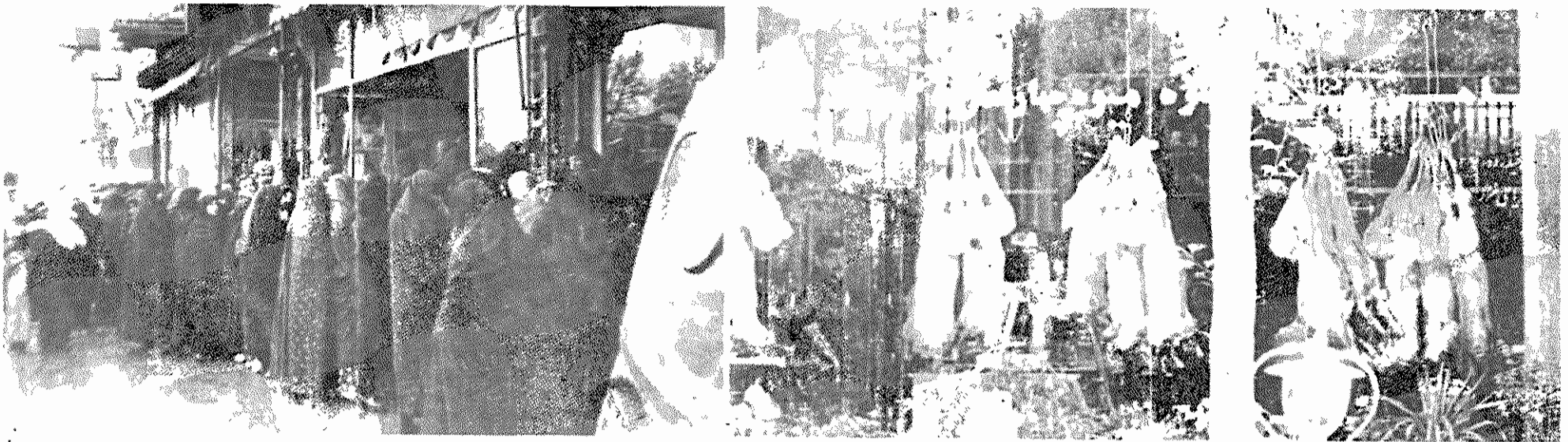
یک سوپر در شمال تهران: به لاشه‌های گوشت تازه گوسفند توجه کنید، که انتظار مشتریهای پولدار را می‌کشند