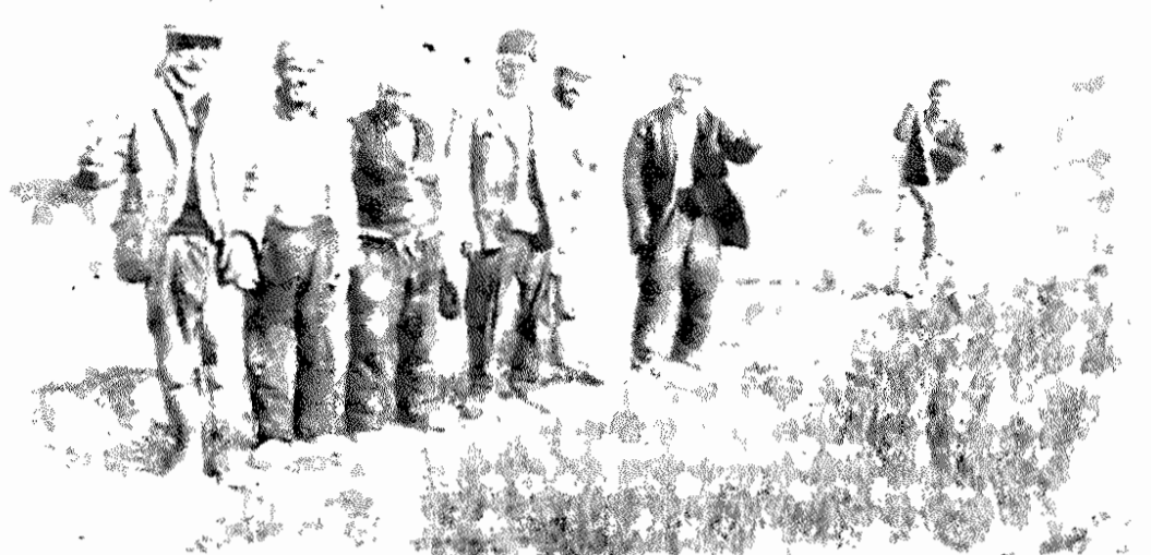
دهقانان زحمتکش روستای ساخسولی، نزدیک تبریز