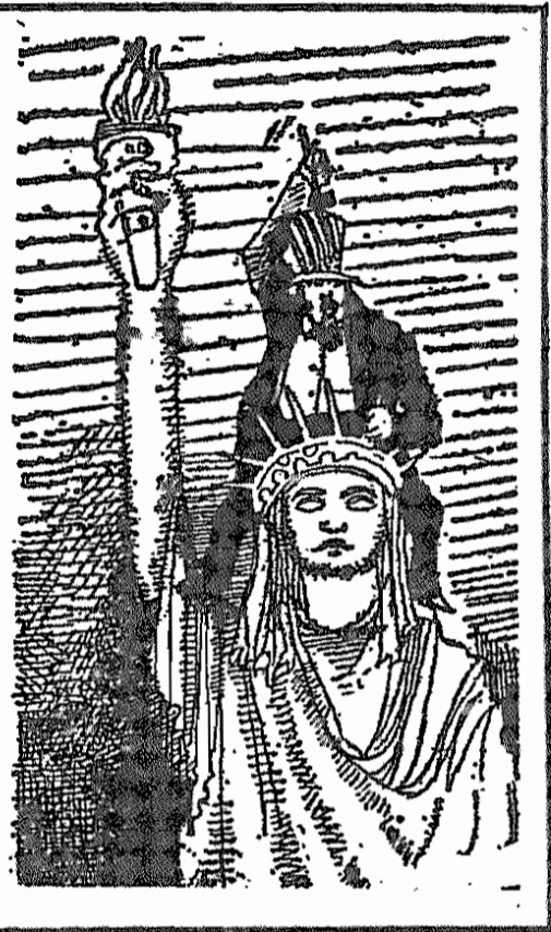
(اطلاعات، ۲۸ خرداد ۱۳۵۹)

علی اکبر معین فر، وزیر نفت ایران دیروز در یک گفتگوی اختصاصی با خبرنگاری پارس سیاست نفتی عربستان سعودی را شدیداً مورد نکوهش قرار داد. وی در پاسخ این سؤال که نوشتن گزارش داده است، شیخ احمد زکریانی وزیر نفت عربستان سعودی در یک محاسبه مطبوعاتی در لندن اعلام کرده که سیاستی که در ۱۸ ماهه اخیر در خصوص بهای نفت آغاز شده است، جهت دامن زدن به بحران اقتصادی جهان بوده است نظر شما نسبت به این سخنان زکریانی چیست گفت: ... خوب است ایشان بجای آن که غصه اقتصاد جهان را بخورند کمی هم به ملت خود ببندند که این طرز بخرمانه از جانب امپریالیسم آمریکا غارت میشوند و ایشان هم بعنوان یک عامل دست‌نشانده امپریالیسم موجب انتقال ثروت ملی مردم جزیره‌الرب به کشورهای صنعتی میگردند. (اطلاعات، ۲۸ خرداد)