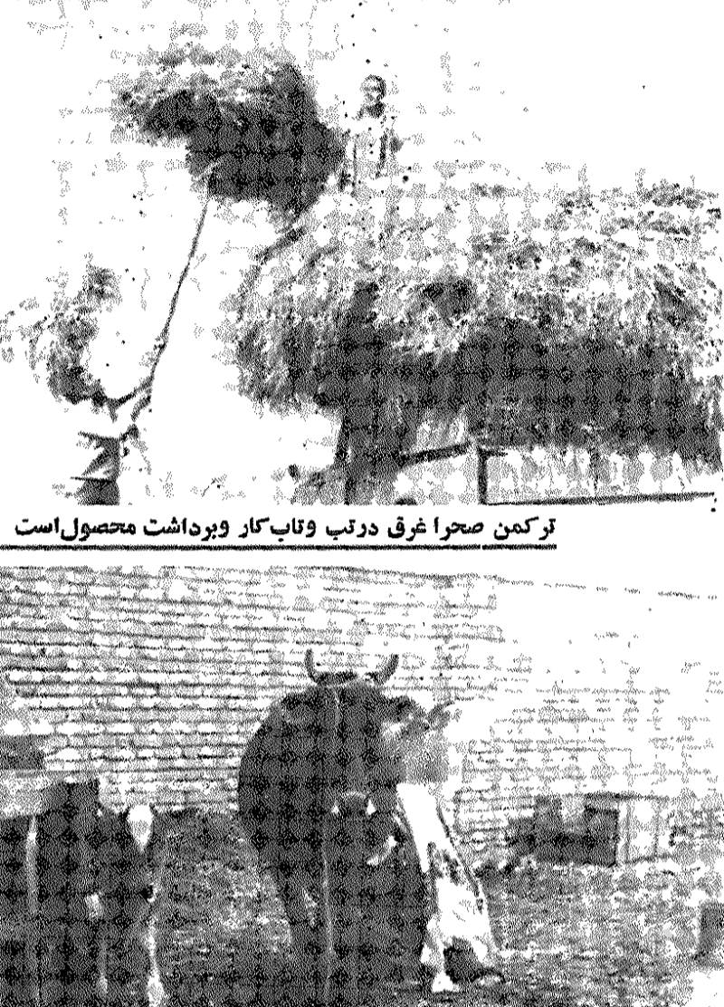
ترکمن صحرا غرق در تب و تاب کار و برداشت محصول است

دهقانی در مورد رضا اصفهانی می‌گوید: «او را ما در تلویزیون دیدیم و یکبار نیز پدرم از او تشریف می‌کرد، او خیلی از کشاورزان و دهقانان حمایت میکند. امیدوارم خداوند او را سلامت کند و بتواند زمین‌ها را از اربابها گرفته و به زمینداران بدهد».