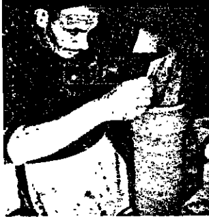
استاد کوزه گر: امروز هیچکس بداند ابتکار نمی رود، چون کار فوق العاده پرزحمت و طاقت فرسای است، و در مقابل، مقدار پولی که برای ما می ماند خیلی کم است و سهام زمستان هم یکتا می ریزد

در سمت جنوب تهرتی رنجان، با این استگاها رومخانه های رنجان و هم چنین هوای پاک کوه ها و دشت های خوب این شهر، هر روز دو مرد از کوره ها و کاشانه خود در شهر روانه چهارده توری فدیسی می شوند و عصرها دوباره پس از شستوی دشت ها و باها مطرف شیر نازمی کنند. آنها برای چه کاری هر روز ارشیر حارج می بود و دوباره به سربار می گردند؟ اگر در دشت این دو نفر به خوبی نگرسی نبود، بکنار سالیان دواز را در دشت ها و و صورتی بار ما دگان کوره گری همند، که به حساب خود ادامه می دهند. با نگاهی کوتاه به کارگاه این سبوسازان و سمال-گران می توان دریافت که این صنعت صنم است، برای آنکه در حدود سی هزار سال عمر دارد، هنوز اصالت و سالیان هایش را در زمانی پیش کشیده است. در رنجان، قبل از به اصطلاح انقلاب سفید، حدود بیست کارگاه کوره گری وجود داشت، ولی بعد از آن که کشته نشینان اغلب از بحال استفاده کردند، کارگاه های کوره گری فقط برای دستا کوره می ماند و هنوز به زندگی و پاسداری این کارگاه در رنجان به خاطر صرف روستاها است. اکثر روزی روستائیان قادر به کارگاه های فدیسی نیستند. در حالی که در گذشته در حدود بیست و هفت کارگاه کوره گری در رنجان وجود داشت. کارگاه های کوره گری فقط برای دستا کوره می ماند و هنوز به زندگی و پاسداری این کارگاه در رنجان به خاطر صرف روستاها است. اکثر روزی روستائیان قادر به کارگاه های فدیسی نیستند. در حالی که در گذشته در حدود بیست و هفت کارگاه کوره گری در رنجان وجود داشت.