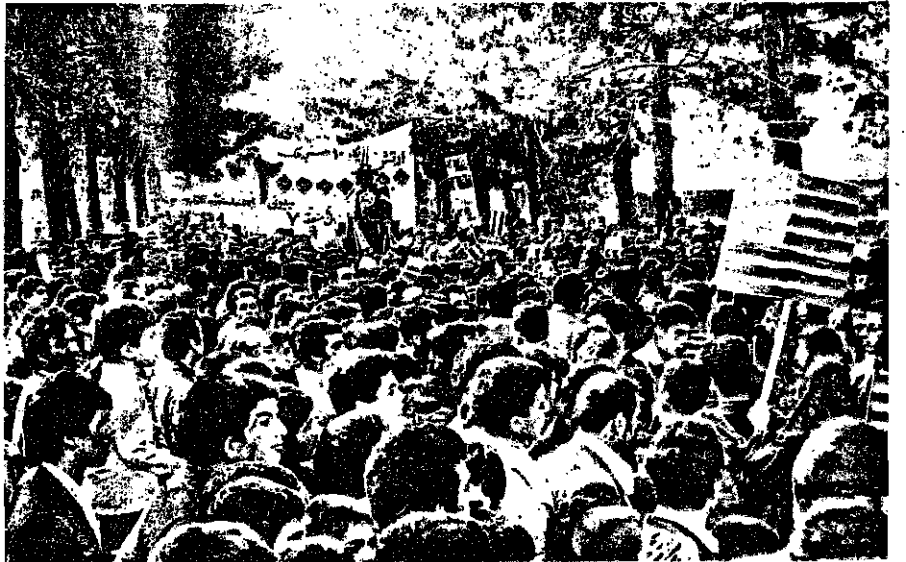
موجی از دریای توفان خلق. اینجا داخل لانه جاسوسی است. بچه‌های باغیچ آباد رنگارنگ را مهار زده‌اند و می‌آورند.

● حجت الاسلام خوئینی‌ها: بدانید، بدانید، بدانید که آمریکا دشمن اصلی ماست. آمریکا دشمن شماره یک ماست، نباید، آنروز که شعار مردم آمریکا، از زبان ما بیفتد، نکند با شعار دیگر، جای شعار مردم آمریکا را پر کنند. ● تا ایران هست و تا اسلام هست و تا آمریکای جهانخواهر هست، باز هم برای همیشه آمریکا دشمن ماست، تمام تفنگها باید به سمت آمریکا نشانه برود. ● نخست‌وزیر: آمریکا دشمن قطعی این انقلاب ماست و دست از سر ما بر نخواهد داشت. اگر خود آمریکا هم مستقیماً با ما رود روبرو شود، ایران را غورستان مزدوران و خودش خواهیم کرد.