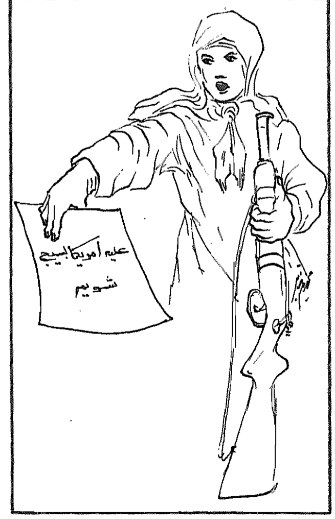
کانون صنفی فرهنگیان