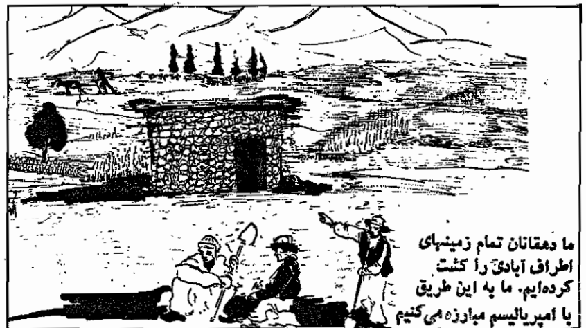
ما دهقانان تمام زمینهای اطراف آبادی را کشت کرده ایم. ما به این طریق با امپریالیسم مبارزه می کنیم

دهقانان زحمتکش! دفاع از زمین و در هم شکستن توطنه امریکا بمعنای تولید بیشتر و کشت بیشتر نیز هست. یک وجب از زمین زراعی را بدون کشت نگذارید. بیل شما که بر زمین فرو میرود سوزنهای است به قلب دشمن