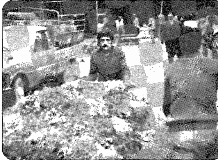
ما باید ایران را حفظ کنیم، وظیفه ما این است که به جبهه کمک کنیم.