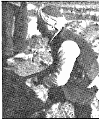
مشهدی عبدالله جوی آب را صاف می‌کند. بی-آب که زمین بارور نمی‌شود.