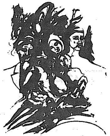
رژیم توده ایران