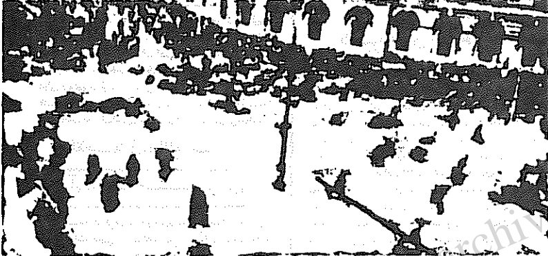
مکره الا صحنای از گشت مردم روسه در برابر کاخ تزار در روز یکشنبه عینین در آستانه انقلاب ۱۳۰۵ - نشان می دهد - مظهری روزی که در وقت تاریخ نگار شد. وزارت عین آسام ایران راه ملک بیسی خود را برانگیزه ...

تظاهرات و تظاهرات دانشجو یی در سبلی ننگ و دیگر دانشگاهها با صمبه های مشابه دانشگاههای عمومی جوانان داشتند.