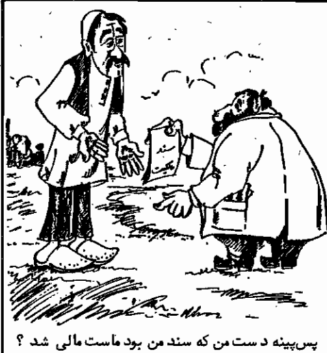
پس پینه دست من که سند من بود ماست مالی شد؟

بوده و هست . جمهوری اسلامی ایران نباید پیه زندان زحمتکشان و مدافعان زحمتکشان تبدیل شود! ما، همصدا با تمام زحمتکشان میهن ما، همصدا با خانواده های دهقانان زندانی، به این حق کشی، به این پشت کردن به منافع دهقان اعتراض می کنیم و آزادی فوری و بی قید و شرط دهقانان زندانی را می طلبیم . ما، همصدا با دهقانان می طلبیم که اصلاحات ارضی انقلابی اجرا شود و زمین به دهقانان تعلق گیرد!