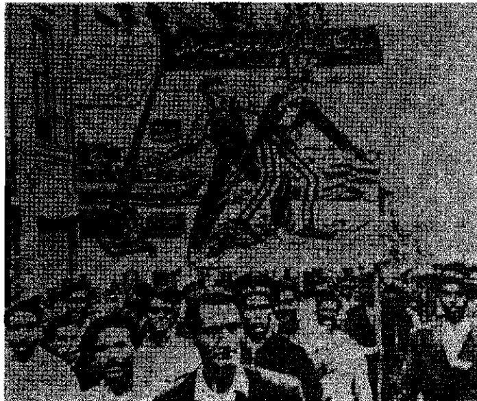
یکی از تظاهرات اول ماه مه قبل از ۲۸ مرداد ۱۳۲۲

هجوم ارتجاع برای سرکوب جنبش کارگری، کارگران مبارز ایران را به فکر واداشت تا با