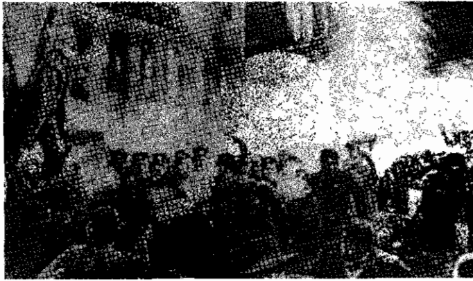
اول ماه مه سال ۱۸۸۶ - شیکاگو

روز اول ماه مه کارگران شیکاگو با اعلام اعتصاب دست به تظاهرات می زنند. آنان با پوشیدن لباس نو و به همراه زن و فرزندانشان خود به خیابان ها می ریزند و قدرت و اتحاد خود را به نمایش می گذارند و اعتراض خود را نسبت به ساعات نامحدود کار اعلام می دارند. طی چند روز تعداد اعتصاب کنندگان افزایش یافته از ۸۰ هزار نفری