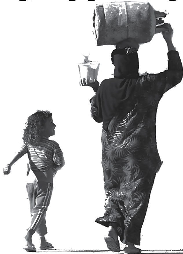
گفت و گو با یک زن زخمی خرمشهر