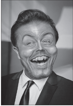
ریکی جارویس (Ricky Gervais)

کمدین و فیلم ساز انگلیسی است که اخیراً مقاله او با عنوان «چرا به خدا اعتقاد ندارم» جنجال به پا کرد. بعد از این مقاله، «ریکی» پرسش و پاسخ های خوانندگان روزنامه وال استریت ژورنال را جواب داد. اکنون ترجمه بخش هایی از آن را در اختیار شما قرار می دهیم.