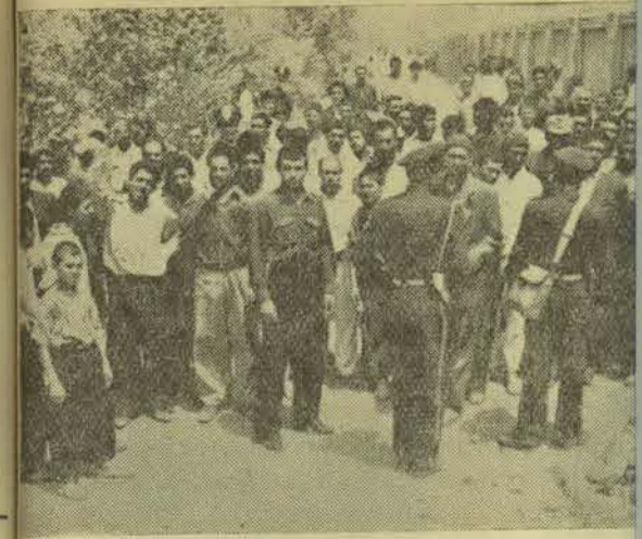
کارخانه چرمسازی امید که امروز اعتصاب کردند

بود که کارخانه چرمسازی امید واقع در بیرون دروازه حضرت (ری) بسته شده بود روز پنجشنبه کارفرما میخواست که مجدداً کارخانه را بازگشاید که چند نفر از کارگران سابق را از کار برکنار و کارگران جدیدی را استخدام کرد.