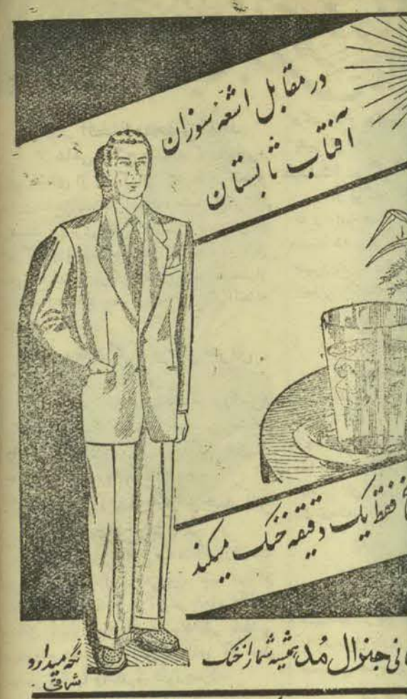
نایب‌المرکز مدعی شرفیاری است

CALCIUM SAND CHOCOLATE کلسیم هاندوز شکلات