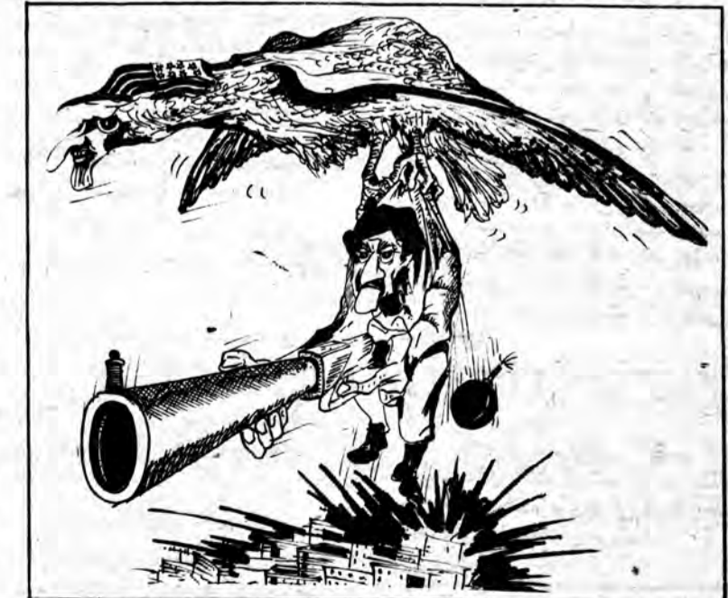
زیوال جرج پال

مبارزه با دشمنان خود در دام دشمنان سوگند خورده، انقلاب ایران افتاده اند، با درایت و بصورتی برخورد کنند. در همان حال که قاطعیت در سرکوب پایگاه های داخلی امپریالیسم تروریسم را در عمل منفرد می کند، درایت در برابر فریب — خوردگان و باز کردن راه برای آنها، به خشک کردن ریشه تروریسم یاری می — رساند. ما بازم تا کید می کنیم که تروریست