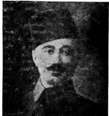
در صفحه ۷