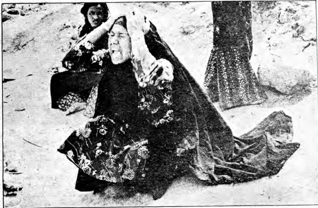
راه ورود صدام با نعره‌های ناسیونالیستی اش برای هم میهنان عرب زبان خوزستانی ما، به سوگ از دست رفته‌های دشمنانند. جنایات صدام هر روز صحنه‌هایی از این دست می‌آفرینند.

حجت الاسلام رفسنجانی رئیس مجلس شورای اسلامی درباره زکشت از سربزه‌های کشورهای الجزایر - لیبی -