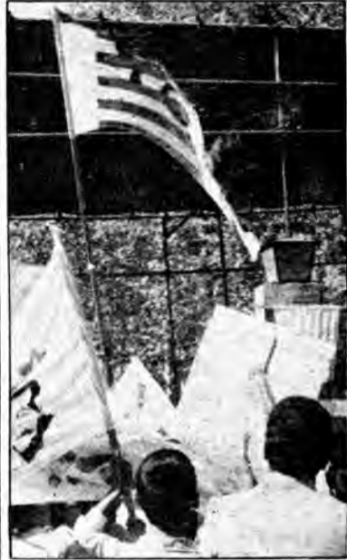
اسلامی ایران را با عزل و طرد بنی صدر و تفاله های شیطان بزرگ آغاز نمود.