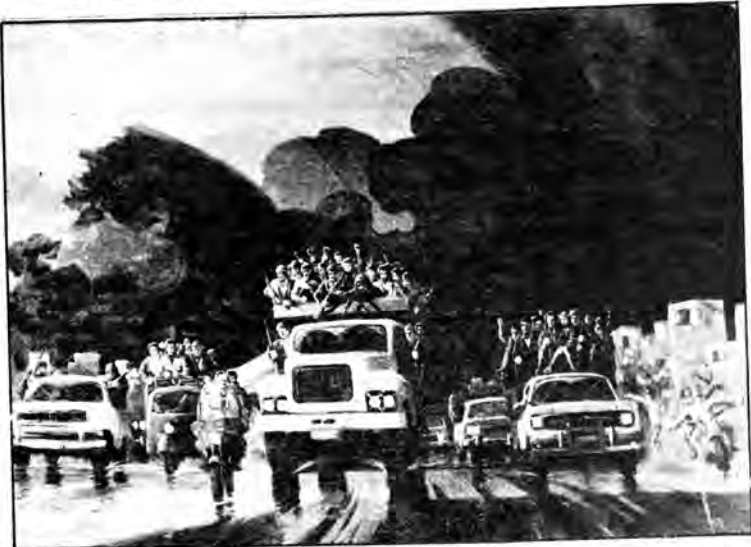
بعد از باران، اثر پرویز حبیب پور

چندی پیش در محل "شورای نویسندگان و هنرمندان ایران" نمایشگاهی از آثار پرویز حبیب پور برپا بود. بخش اعظم تابلوهایی که در این نمایشگاه عرضه شده، در آخرین برپایی "تالار نقش" تحت عنوان "از زندان تا قیام" به نمایش درآمده بود. کارهایی از زنده و قابل تحسین، که اغلبشان با تکنیکی نیرومند و مسلط آفریده شده اند و هریک به نوبه خود گوشه‌ای از واقعیات شوم و دردآلودی را، که تار و پود جامعه، طاغوت زده، ما را تشکیل می‌داد، می‌نمایانند. کارهایی چون "خندان کن ها"، که از فقر و استثمار که بر مردم تحمیل شده بود، مردمی که خود زیر فشار پلشتی و زشتی مناسباتی که بر آنان حاکم است، قرار داشتند و با اینحال به "خندان کردن"، به زیبا-تر کردن بسته‌ها مشغولند، کارهایی چون "نیمه شب"، "اولین ملاقات"، "روز-نامه خوان ها" و "خدا حافظی"، که به تاریخ مبارزات مردمی که خواستند زیر فشار اختناق، زور و ستمی که بر همه روا می‌شد، ساکت بمانند، غنائسی در خور می‌بخشد. این تابلوها، به حق، بیانگر زندگی فاجعه آمیز و در عین حال قهرمانانه مبارزاتی است که بخاطر ستیز علیه هر چه برابری و ناسامانی است، "زندگی" را ترک می‌گویند و در گوشه سیاهچال‌های ساواک به بند کشیده می‌شوند. و نیز کارهایی چون "صبح روز ۲۲ بهمن" و "با کجا"، که با الهام از انقلاب و به نیت ستایش از آن آفریده شده اند.