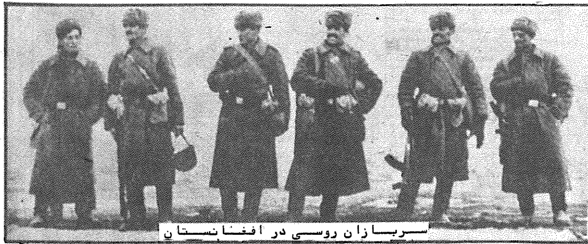
سربازان روسی در افغانستان

حمله‌ی شوروی به افغانستان و اشغال این کشور، عمل نسبتاً شدیدی را از طرف آمریکا بوجود آورد و این مسئله در زمینه‌های رقابت شدید میان آنها برای سلطه بر جهان، خطر تصادم میان این دو ابرقدرت و خطر جنگ منطقه‌ای و سپس جهانی را تشدید کرده است.