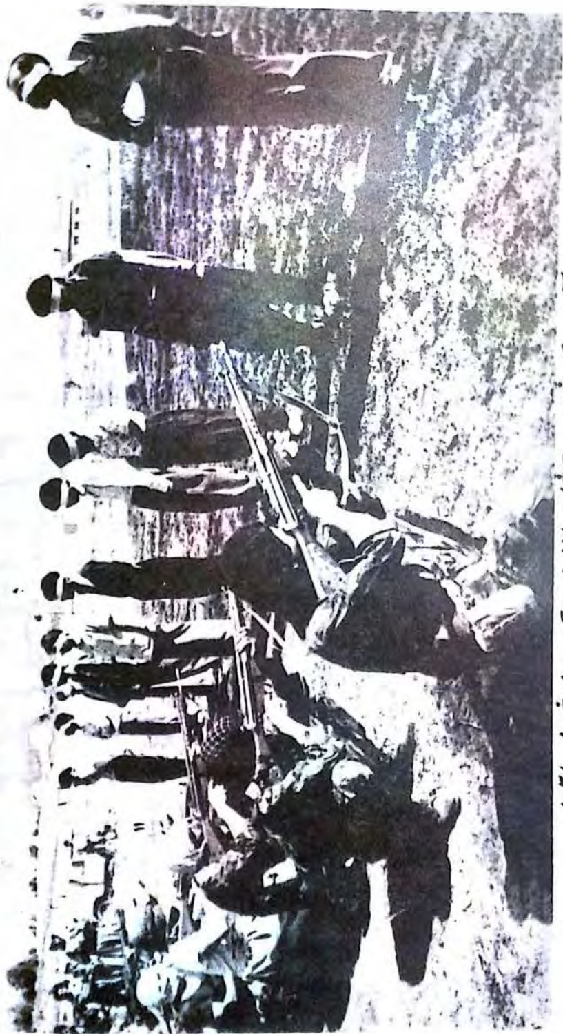
آنها می‌کشند دستشان را از خون توده‌ها بشویند، اما خون شهیدان هرگز از دست هیچ جلادی پاک نمی‌شود.