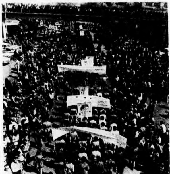
صفوف منظم میلیشیا در سراسر راهپیمائی، با تشویق و کف‌زدن و کلاب و نقل پاشیدن‌های مردم که به تماشا می‌آمده بودند. روبرو بود

مقدمای یادآور سویم که چون درک صحیح از آنچه بوزن در طول تاریخ گذشته در محدوده‌ی بررسی