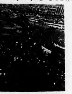
میدان امام خمینی (تویخانه ی سابق) ملولان ملتسای است آنها رژه می روند سرود می خوانند و به خلق می دهند و دشمنان خلق را به خشم می آورند.

عظم آهسی و انقلابی ملتسای همراهِ با حرکات نظامی و تکرار شعارهای رزمی و سیاسی از قبل "ک... دو... سه...". مرکز بر آمریکا "به نعت واداسه و حتی برخی عناصر مرتجع را که در طول مسیر با حمل این چنین نمایی را ندانستند بهت زده کرده بود. راجح ترین شعارهایی را که ملتسای در روز جمعه در تظاهرات وحدت بر سر رانها انداخت عبارت بود از: ملتسای، ملتسای، جنگ و عادلانه آمریکا، آمریکا، جنگ نوظالمانه خروش آیرس خلق، سرد، آمریکا