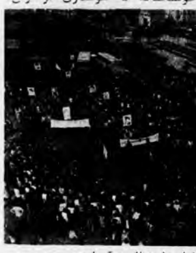
میدان امام خمینی (تویخانه ی سابق) ملولان ملتسای است آنها رژه می روند سرود می خوانند و به خلق می دهند و دشمنان خلق را به خشم می آورند.

فقد داشتند با حمله به ساد محاهدین خلق ادهان بوده ی مردم را که در این روز تماماً به سوی امپریالیسم آمریکا نشانه رفته بود. محرف نارند. و طبعی است که آبادی امپریالیسم آمریکا در حین سرامتی بی کار نشسته و دست به غرور و عوطه برستند. آنها کار وحدت خلق و اهه دارند. آنها که صانع امپریالیسم را در حلقه می بینند. تلاش می کنند که با حمله به مراکز اغلابیون با اتحاد غروره در سن صفوف یک پارچه ی خلق به ارمانان خود خدمت نمایند. اما حوسخانه با هوساری برادران،