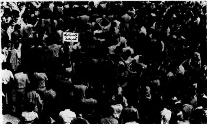
دربای خلق در تظاهرات باشکوه و با مستهباتی کرده خود فریاد مرگ بر آمریکا را سردادند

اگر زمینه‌ی عینی وحدت درست تشخیص داده شود همه‌ی نیروها حول آن جمع شده و تفرقه‌ها فروکش خواهند کرد.