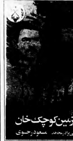
دیدار سرزمین کوچک خان سخنرانی برادر مجاهد مسعود رجوی

روزنامه "مجاهد" نشریه مجاهدین خلق ایران سال اول آدرس: تهران ۱۶ صندوق پستی شماره ۶۴/۱۵۵۱