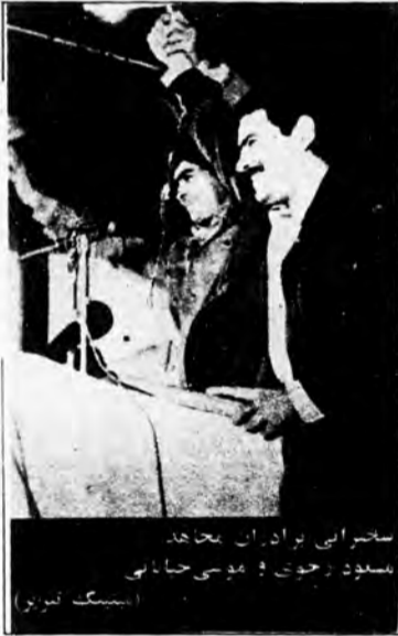
سخنرانی برادران مجاهد مسعود رجوی، موعی حیاتی (اسپک تیرو)

نوارهای جدید سخنرانی‌های مجاهدین خلق منتشر شد.