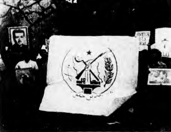
شرکت طرفداران مجاهدین خلق در مراسم فلسطینی‌ها که گروه‌های بسیاری از سازمان‌های آزاد پیشین در آن شرکت کرده بودند.

اکون در فلسطین اوج مبارزات مداوم صدامیرالسی و ضد صهیونیستی خلق عربله آمریکا عکس‌العملی وسیع در سطح سین الفلینی به خریان ایداعه‌ی است. صهیونیزم جاسکار و مرجعین وابسته به آن عامل از موج آگاهی خلقها که حرکتی را همچون سلفی خروشان برای مقدم کردن پایگاههای سواحلی آنان به پیش سراند، در لحظات آخر سه کوشی بی‌نرم موصل گشته است. خلقهای قهرمان فلسطین سرد خود را برای حتی کردن قرارداد کمب دیوید و موافقت‌نامه‌های جیدخانه‌ی سادات - صهیونیست تحت رهبری سازمان آزادیبخش