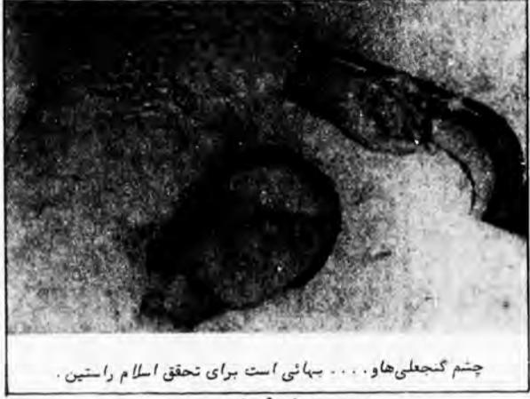
چشم گنجعلی‌ها و... بهائی است برای تحقق اسلام راستین.

این بار برادری از ارومیه چشم خود را در نتیجه‌ی ضرباتی که بوسیله‌ی جماعتداران مسلح معلوم الحال بر وی وارد شده‌از دست داده. جماعتداران او و برادرش را در اطراف ارومیه شدیداً مضروب می‌کنند و می‌گریزند و در نتیجه جسم او اس حسن کورمی -