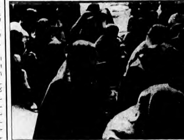
مادران جنوب شهر در مراسم یادبود

غریزان وار عقیده‌ی آنجا که همان اسلام راستین و انقلابی و اسلام مستضعفین است. در برابر نیروهای ارتجاعی نا مرز سهاد دره‌می صحنه‌ها حمایت کنیم. "وی در ادامه‌ی سخنان خود گفت: "... امروز ما مادران جنوب سیر با چشمانی پر از اشک و دلی پر خون بر مزار شما فرزندان مجاهدان جمع شده ایم تا عهدی را که با شما داشتیم تکرار و تجدید کنیم که تا آخرین قطره‌ی خونمان در کنار دیگران راه شما خواهیم بود."