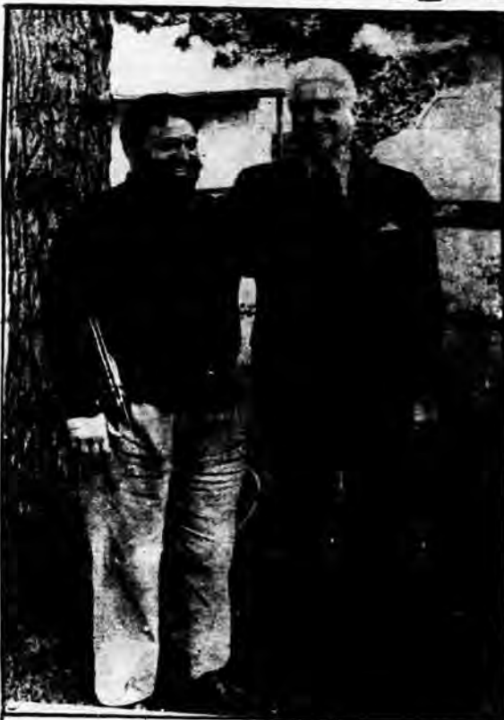
مؤدب و باخضوع در برابر باب

چه اسراوين مى‌خواهند مرا محاكمه كنند؟ آيا به خاطر تلاش من در كشف شيكدهاى جاسوسى "سيا" در ايران؟ از نامه‌هاى سعادتى