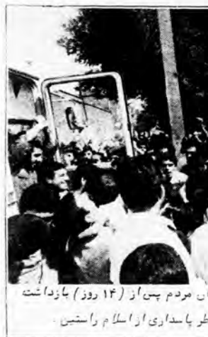
بارگشتی قهرمانانه و شوراگیر به میان مردم پس از (۱۴ روز) بازداشت شکوه و اعتصاب غذا به خاطر پاسداری از اسلام راستین.

یکی از اهالی محل: اس موجودها صد در صد به نفع بنگانه، به نفع آمریکا و جز امیرالاسم به نفع کس دیگری نمی‌تواند باشد، و اگر بخواهند از آزادی فعالیت کسی جلوگیری کنند، نفس ثانوی استی کردندند و این درگیری‌ها جز سوسوم کردن جوخج چیز دیگری ندارد و منجر به اس می‌شود که ما سوسوم بحث آزاد را ادامه دهیم. مردم فرسود محل: اس افراد در محل از لحاظ معاشی و حواری و امثال اینها به مردم می‌رسند.