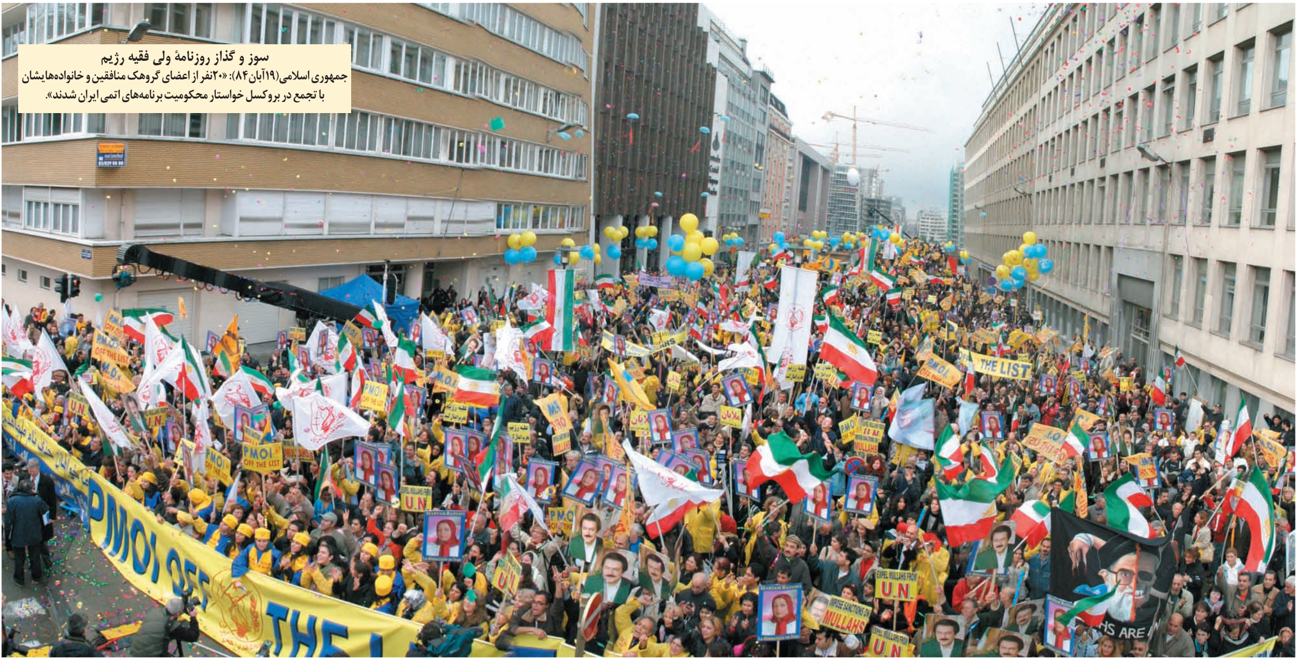
سوز و گداز روزنامه ولی فقیه رژیم جمهوری اسلامی (۱۹ آبان ۸۴): «۲۰ نفر از اعضای گروهک منافقین و خانواده‌هایشان با تجمع در بروکسل خواستار محکومیت برنامه‌های اتمی ایران شدند.»