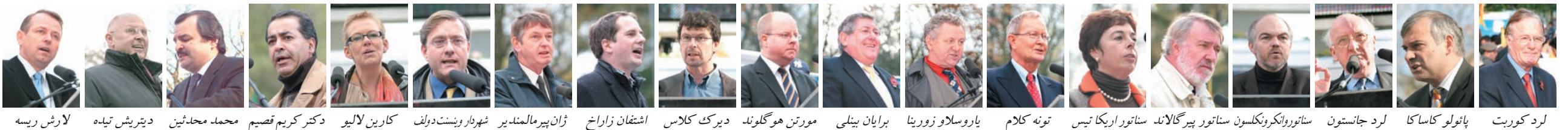
لرد کوربت پائولو کاساکا لرد جانستون ساتورو انکرونکلسون ساتورو پیرگالاند ساتورو اریکا تیس تونه کلام یاروسلاو زورینا برایان بینلی مورتن هوگلوند دیرک کلاس اشفتان زاراخ ژان پیرمالندیر شهرار وینشتدولف کارین لالیو دکتر کریم قسیم محمد محمدرین دیتیش تیده لارش ریس

در بزرگترین تظاهرات ایرانیان در برابر اجلاس وزیران خارجة ۲۵ کشور عضو اتحادیه اروپا: