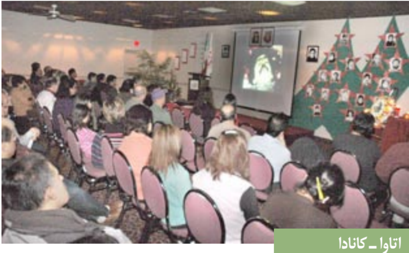
اتاوا - کانادا