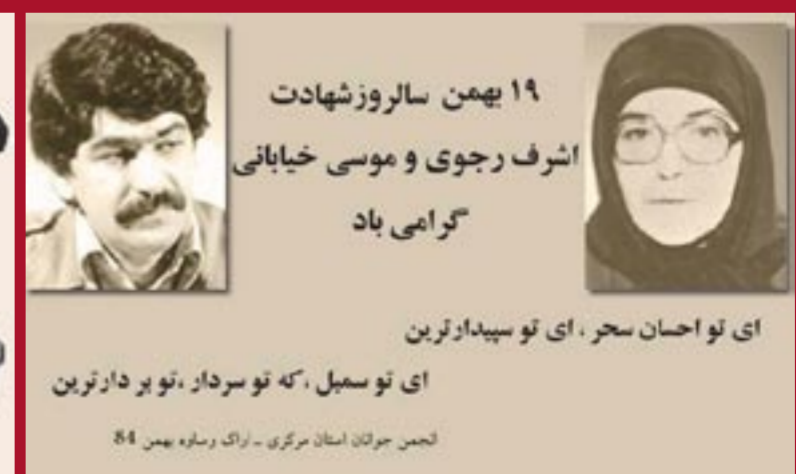
۱۹ بهمن سالروز شهادت اشرف رجوی و موسی خیابانی گرامی باد