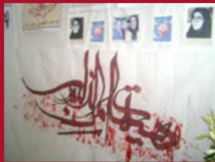
برگزاری مراسم ۱۹ بهمن توسط خانواده‌ها و هواداران مجاهدین در اهواز

تشکل فرهنگیان (تهران) هوادار مجاهدین خلق بهمن ۱۳۸۴