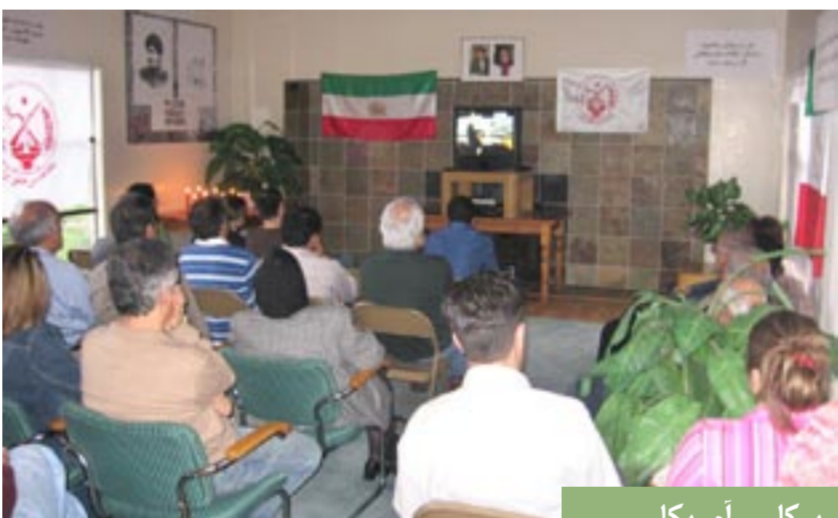
برکلی - آمریکا