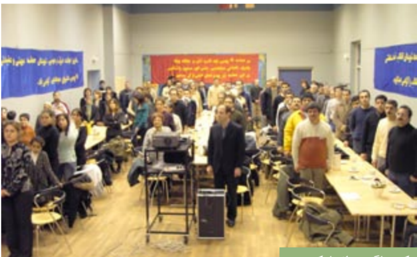
کپنهاگ - دانمارک