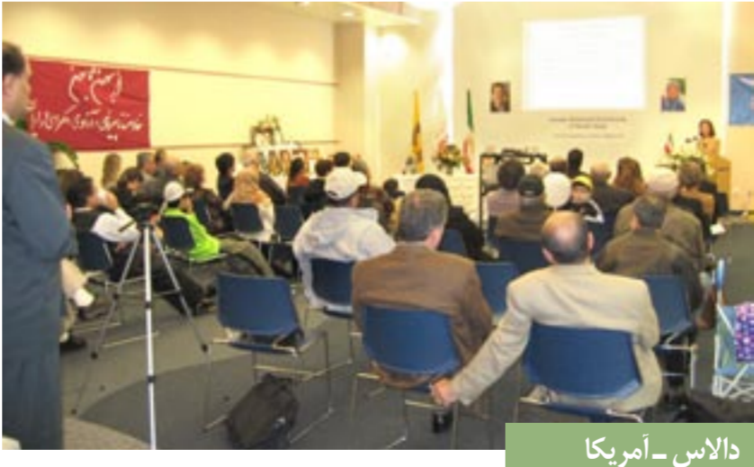
دالاس - آمریکا