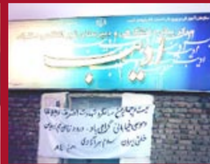
بزرگداشت ۱۹ بهمن توسط هواداران مجاهدین در خوی - آذربایجان غربی