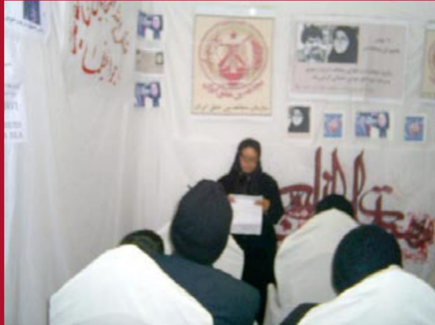
برگزاری مراسم ۱۹ بهمن توسط خانواده‌ها و هواداران مجاهدین در اهواز

انجمن حشمتیه، انجمن ورزشکاران کرج، انجمن آزادیخواهان کرج، انجمن فرهنگیان کرج، انجمن دانشجویان قزوین، انجمن فرهنگیان اصفهان، انجمن اصناف اصفهان، انجمن فرهنگیان مشهد، انجمن کوهنوردان آذربایجان شرقی، انجمن جوانان آذربایجان غربی، انجمن دانشجویان آذربایجان غربی، انجمن دانشجویان استان زنجان، انجمن دانشجویان و دانش‌آموزان چهارمحال بختیاری، انجمن مادران چهارمحال بختیاری، انجمن جوانان آزادیخواه استان کردستان، انجمن دانشجویان استان مرکزی، انجمن زنان آزادیخواه بندرعباس، انجمن دانش‌آموزان و دانشجویان مازندران، انجمن فرهنگیان مازندران، انجمن دانشجویان سیستان و بلوچستان، اطلاعیه‌هایی به‌مناسبت سالگرد عاشورای مجاهدین صادر کردند. در اطلاعیه‌های انجمنهای مختلف ضمن تجلیل از شهدای والا مقام ۱۹ بهمن سال ۶۰ بر ادامه راه آنها تا سرنگونی رژیم ضدبشری آخوندی تأکید شده است.