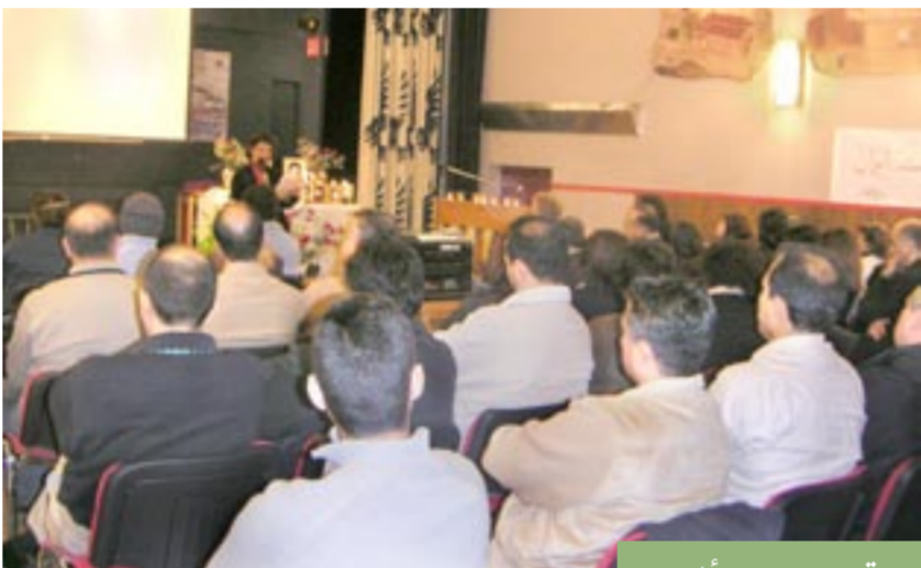
یوتوبوری - سوئد