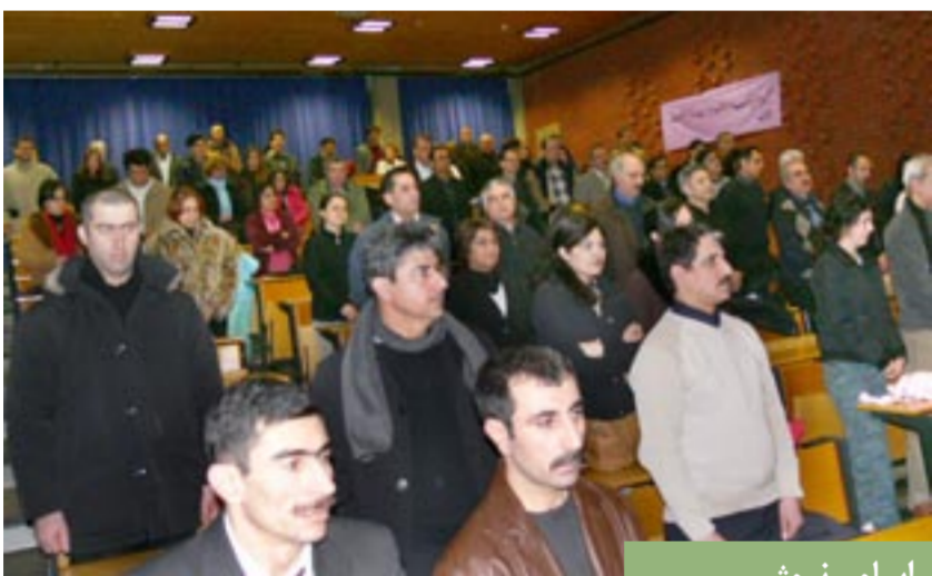
اسلو - نروژ