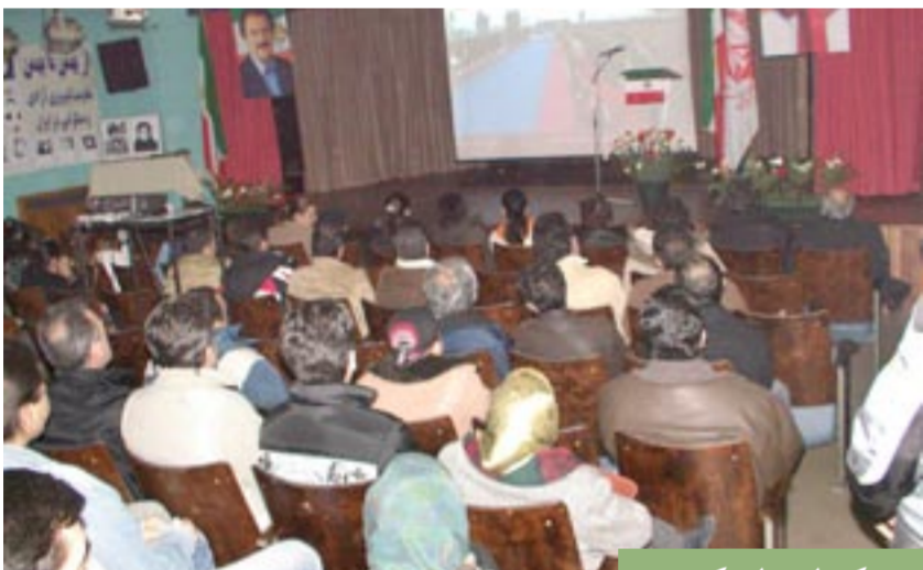
بروکسل - بلژیک