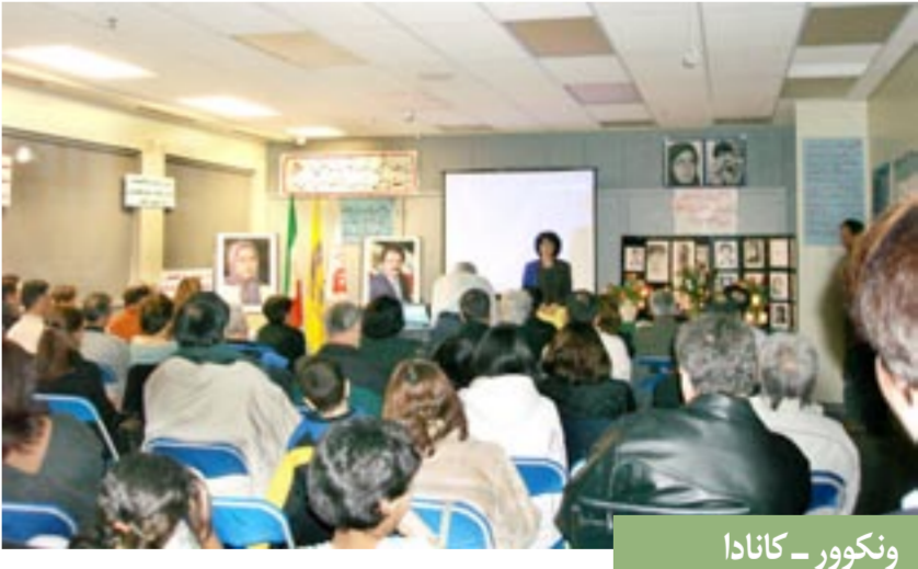
ونکوور - کانادا