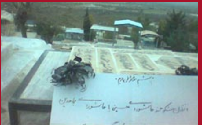
خرم‌آباد - قبرستان خضر محل دفن شهدای مجاهد خلق