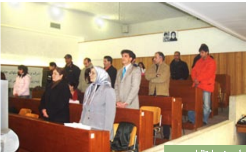
اورینو - ایتالیا