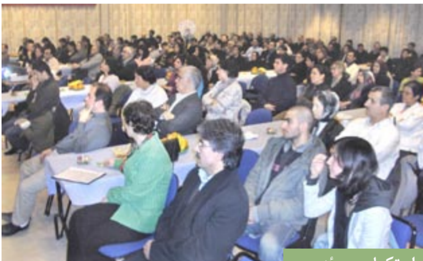
استکهلم - سوئد

هرگز نمی‌خواهم که پیامبر باشم زیرا که، یک لحظه سالیدن با شب جاودانگیت تا معراج خواهد برد.