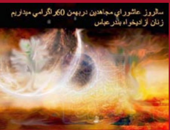
سالروز عاشورای مجاهدین در بهمن ۶۰ لگرمی میداریم زنان را فدای خردمند بندهای