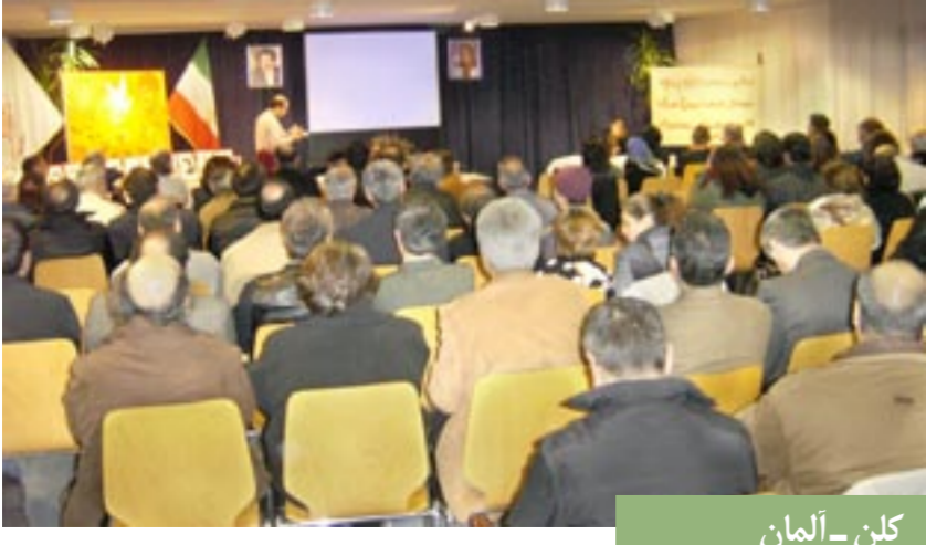
کلن - آلمان

شماری از هموطنان آزاده در هامبورگ آکسیونی به‌مناسبت بیست و هفتمین سالگرد انقلاب ضدسلطنتی برگزار کردند. شرکت‌کنندگان با درود به‌بنیانگذاران، پیشازان، راهگشایان و شهیدان انقلاب ضدسلطنتی و با لعنت ابدی به‌غاصبان حق حاکمیت ملت و باتیان استبداد زیر پرده دین، این روز را گرمی داشتند. ایرانیان آزادیخواه و حامیان خستگی ناپذیر مقاومت شعار می‌دادند دوران پایدانی حاکمیت سارقان انقلاب ضدسلطنتی فرا رسیده است. شرکت‌کنندگان در این آکسیون هم‌چنین خواستار حذف نام سازمان مجاهدین از لیست تروریستی شدند و حمایت