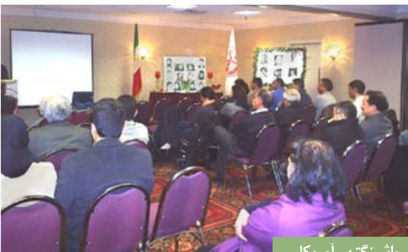
واشینگتن - آمریکا