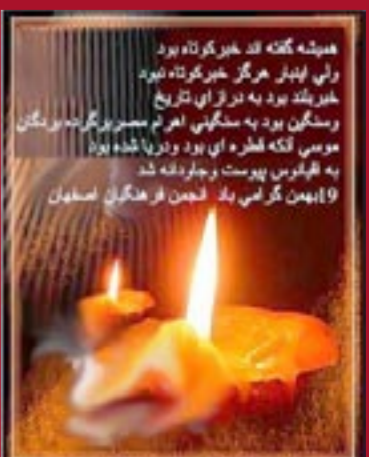
خانواده‌های شهدای مجاهد خلق استان گیلان ۸۴