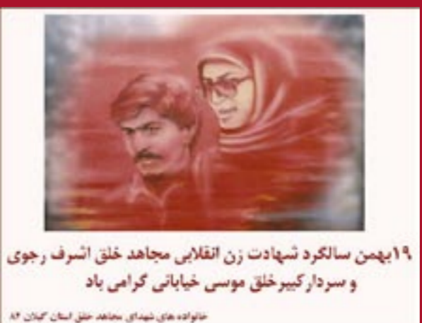
۱۹ بهمن سالگرد شهادت زن انقلابی مجاهد خلق اشرف رجوی و سردار کبیر خلق موسی خیابانی گرامی باد