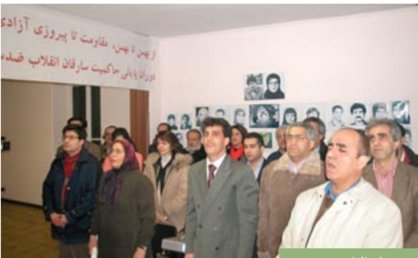
رم - ایتالیا