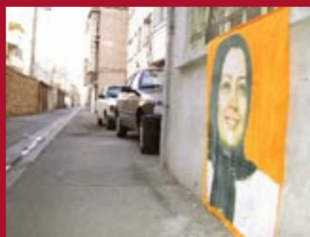
تهران - خیابان مولوی