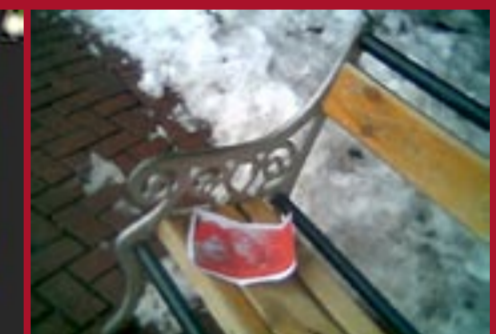
تهران - نیاوران