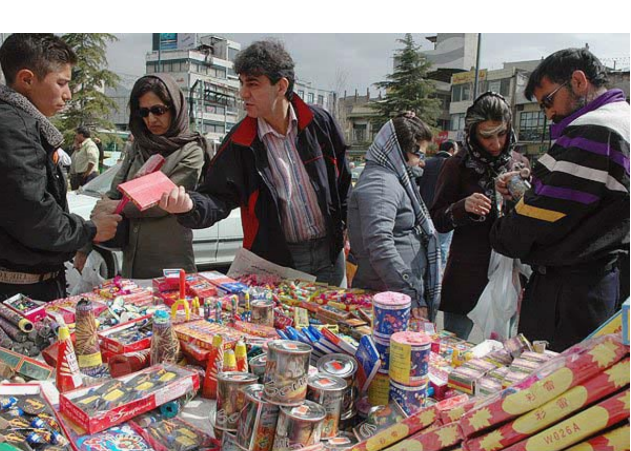
تلاش جوانان شجاع تهران در خرید و تدارک برای جشن آتش در چهارشنبه‌سوری اسمال رژیم را به هراس انداخته‌است