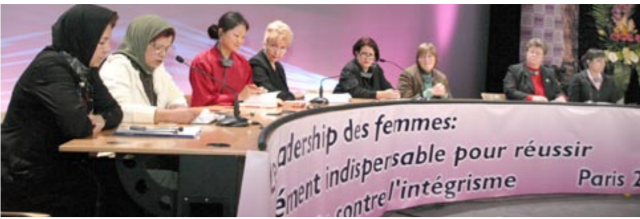
پنل بحث پیرامون بنیادگرایی