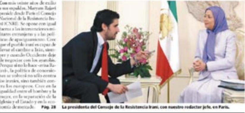
La presidenta del Consejo de la Resistencia iraní, con nuestro redactor jefe, en París. Pág. 28

رئیس‌جمهور برگزیدهٔ شورای ملی مقاومت ایران: