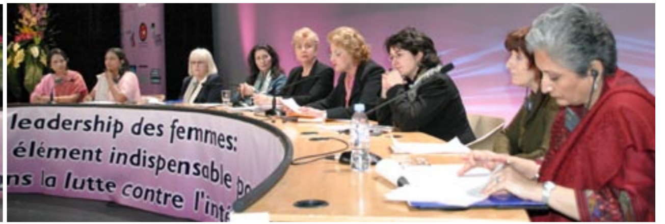
پنل بحث حول ضرورت رهبری زنان