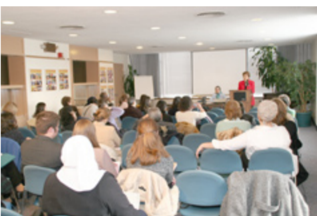
در این مسیر از دست داده‌اند، در میان آنها ما شاهد زنانی هستیم مانند اشرف رجوی که در زمان شاه، در زندانهای شاه تحت شکنجه شونایی یک گوش