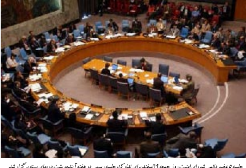
جلسه ۵ عصری شورای امنیت روز جمعه ۱۸ اسفند برای تدارک جلسه رسمی در هفته آینده، پشت درهای بسته برگزار شد.