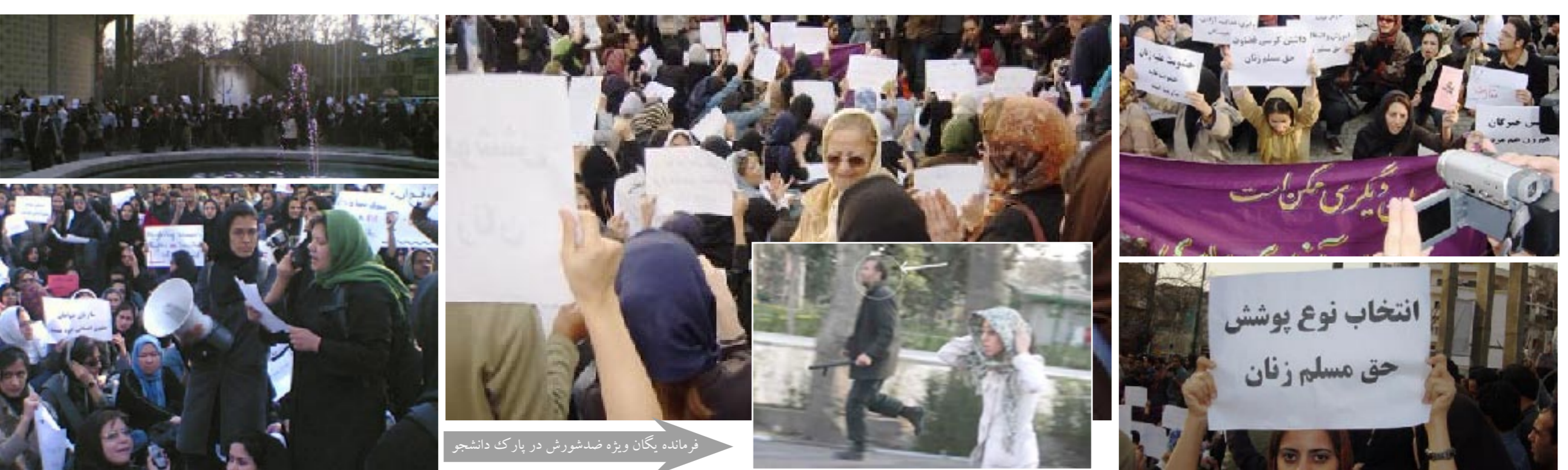
فرمانده یگان ویژه ضدشورش در پارک دانشجو

تجمع ۲۰۰ تن از زنان آزاده میهنان در ساعت ۱۶:۳۰ در پارک دانشجو تهران مورد تهاجم نیروی انتظامی و لباس شخصیها قرار گرفت.