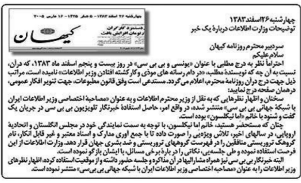
سند شماره دو

-یادآوری می‌کنیم که در اسفندماه سال گذشته، مطبوعات حکومتی رژیم آخوندی در جریان جنگ گرگها و دعواهای درونی حاکمیت از یک فقره دیدارهای وزیر اطلاعات رژیم با یک زن انگلیسی به‌نام امبیکلسون و خبرنگار بی.بی.سی به‌منظور بهره‌برداری از آنان علیه مجاهدین، پرده برداشتند.