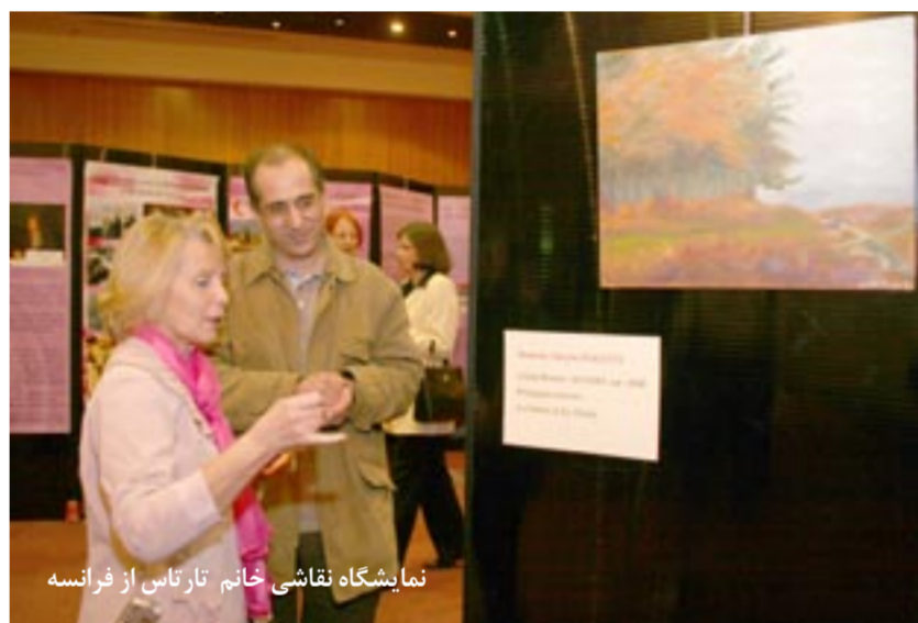
نمایشگاه نقاشی خانم تارتاس از فرانسه