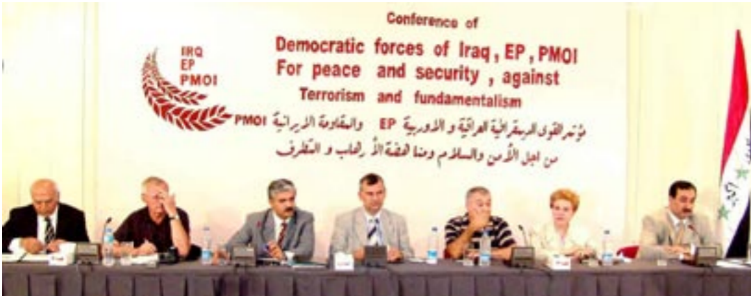
اجلاس مشترک نیروهای دموکراتیک عراق، هیأت پارلمان اروپا و سازمان مجاهدین خلق ایران

ایران در یک جلسه نمایش فیلم و پرسش و پاسخ ۱۵مرداد - کنفرانس سازمان جهانی زنان علیه بنیادگرایی در تورنتو ۱۵مرداد - آکسیون هواداران مقاومت در کلن در اعتراض به سرکوبی و کشتار مردم توسط رژیم در کردستان ۱۷مرداد - در کنفرانس مطبوعاتی مقاومت در وین جزئیات جدیدی از پروژه اتمی رژیم افشا شد ۱۸مرداد - تجمع اعتراضی هواداران مقاومت در مقابل مقر آژانس بین المللی انرژی اتمی در وین ۲۰ و ۲۱ مرداد - تظاهرات و تجمعات هواداران در شهرهای مختلف کشورهای اروپایی (لندن، وین، اسلو، برلین، کپنهاگ، رم) در اعتراض به ربوده شدن دو مجاهد خلق در بغداد ۲۲مرداد - بزرگداشت شهیدان قتل عام زندانیان سیاسی در سال ۶۷ در شهر لاهه هلند ۲۲مرداد - در یک کنفرانس بزرگ مطبوعاتی در شهر پاریس با عنوان «یک پیروزی برای عدالت» اعلام شد دادگاه اداری سرژی پوتوزاف فرانسه طی محکم جادگاه دستورات وزیر کشور فرانسه دائر بر اخراج و تبعید ۵۰ تن از اعضای مقاومت را لغو کرد و دولت فرانسه را به پرداخت غرامتی معادل ۳۰۰۰ یورو به هر یک از این هفتاد محکوم نمود. ۱۹ تا ۲۳مرداد - اجلاس سراسری شبکه زنان برای کسب قدرت در شهر سن دیه گو در کالیفرنیا با عنوان «نقش زنان در دنیای قدرت، برابری و عدالت» با حضور سوزان دیویس، نماینده کنگره آمریکا و بونی دومانیس، دادستانی سن دیه گو و سونا مصمصامی ۲۴مرداد - گروهی از شیوخ عشایر و