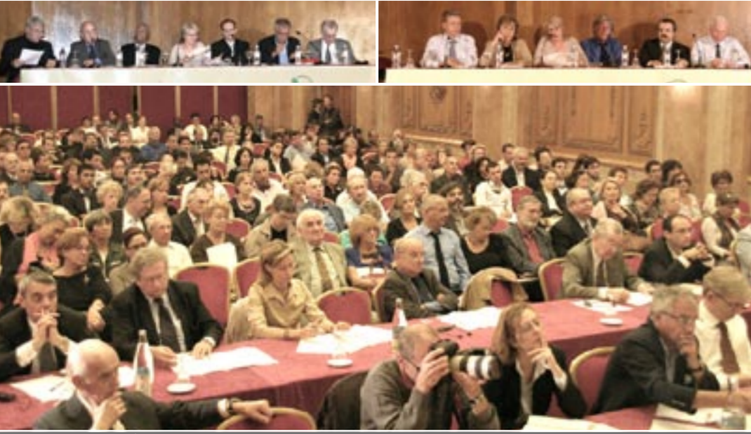
کنفرانس بین‌المللی پاریس برای بررسی تهدیدهای برنامه اتمی رژیم ایران و راههای مقابله با آن