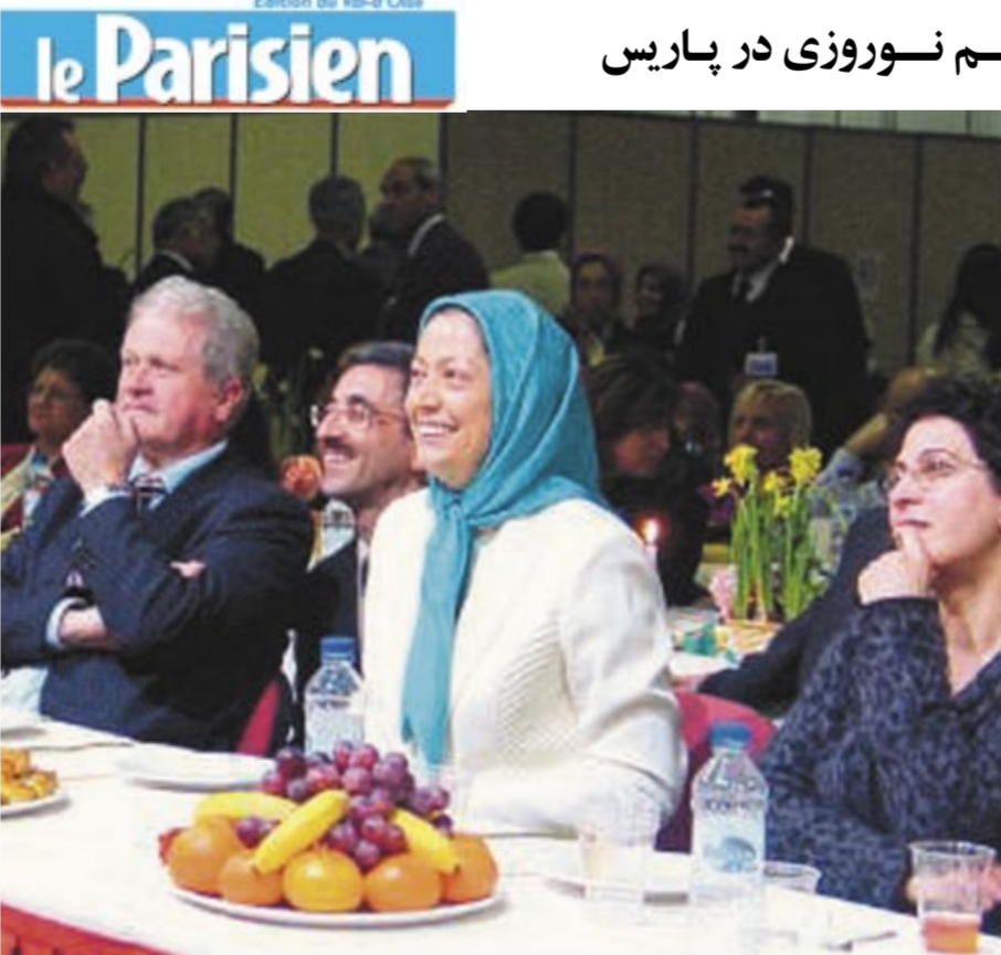
روزنامه پاریزین: پورتو، سالن سن مارتین - مریم رجوی (در وسط)، رهبر مقاومت در تبعید، در کنار ژرار شاراس، نماینده حزب رادیکال چپ از استان آلیه، که برای اعلام حمایت به محل آمده بود.