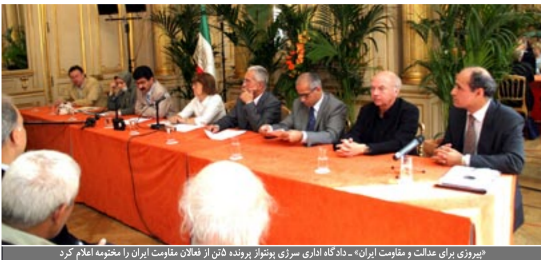
«پیروزی برای عدالت و مقاومت ایران» - دادگاه اداری سرژی پوتوزاف برنده ۵۰ تن از فعالان مقاومت ایران را موقوفه اعلام کرد