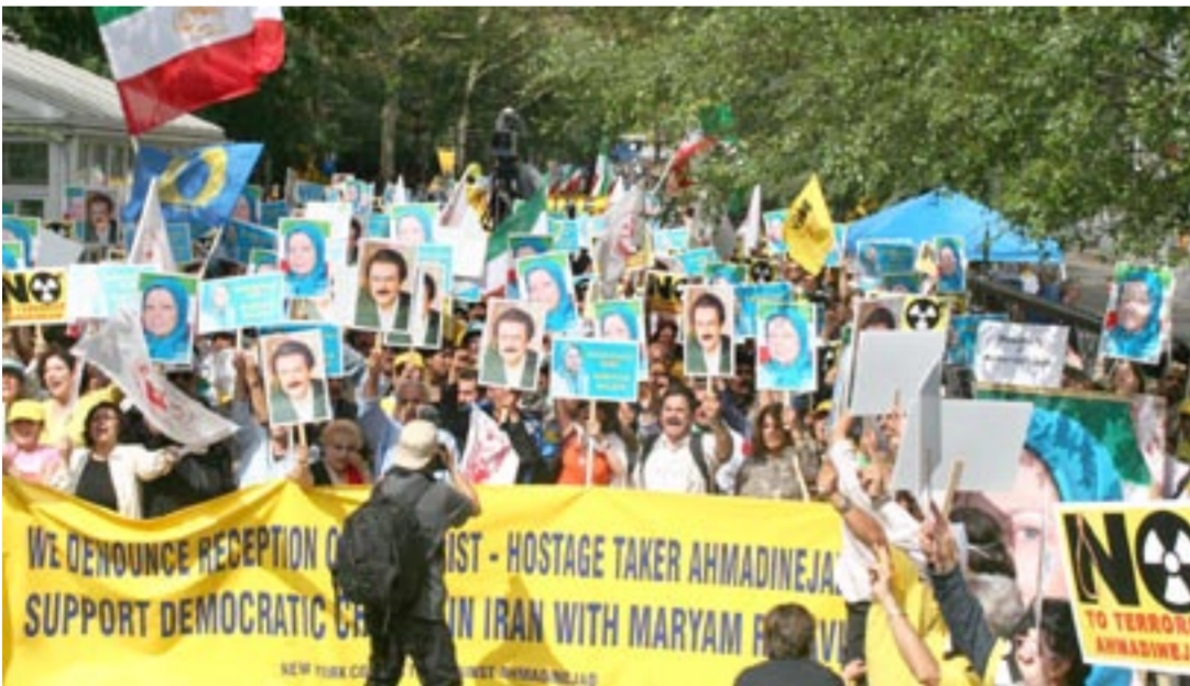
بزرگترین تظاهرات ایرانیان در نیویورک علیه حضور احمدی نژاد و برای حذف تروریستی