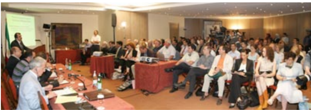
کنفرانس افشای پروژههای مخفی اتمی رژیم آخوندی در پاریس