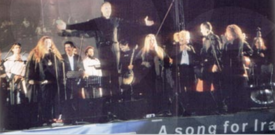
کنسرت همبستگی با مقاومت ایران در یونان