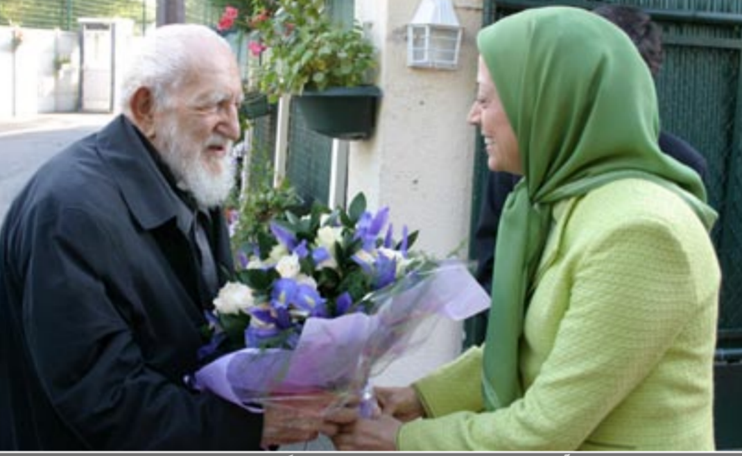
دیدار آبه پیر محبوبترین شخصیت فرانسه با رئیس‌جمهور برگزیده مقاومت در اورسوراواز