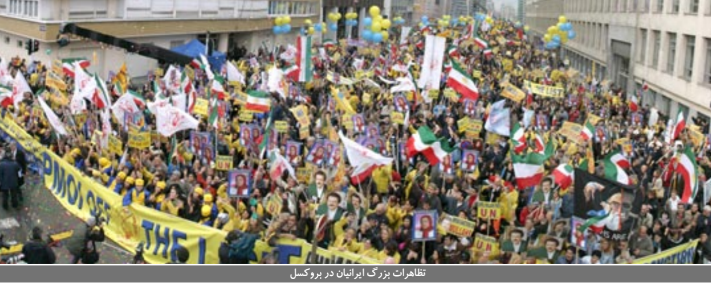
تظاهرات بزرگ ایرانیان در بروکسل