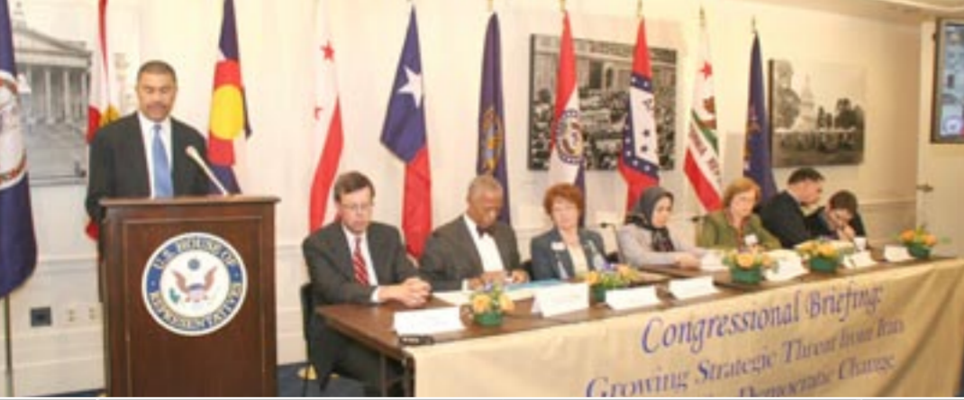
قانونگذاران آمریکایی در جلسه‌ای در سالن مشترک سنا و نمایندگان ایالات متحده، بر ضرورت تغییر دموکراتیک در ایران تأکید کردند