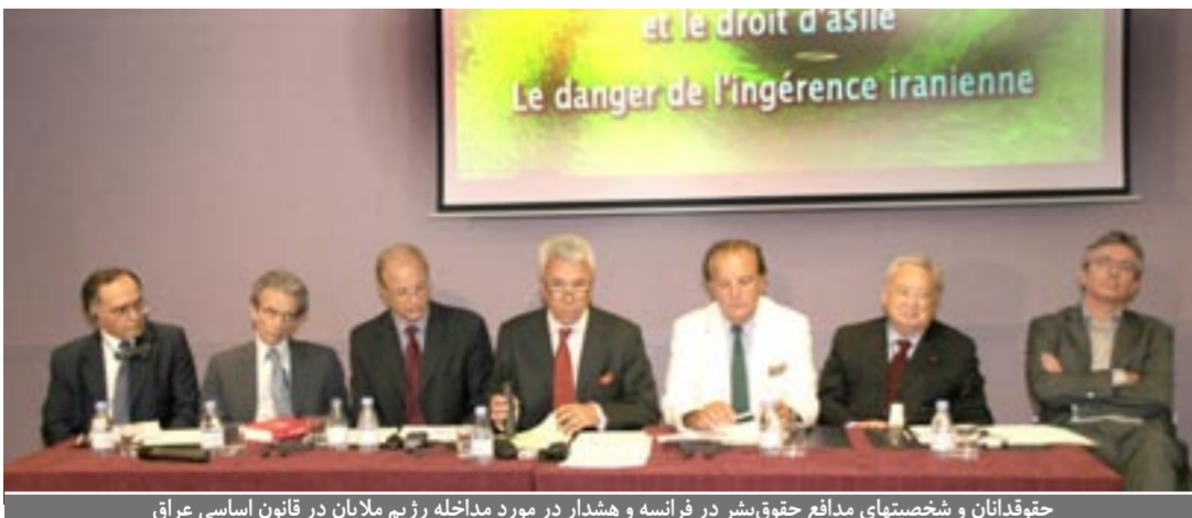
حقوقدانان و شخصیتهای مدافع حقوق بشر در فرانسه و هشدار در مورد مداخله رژیم ملایان در قانون اساسی عراق