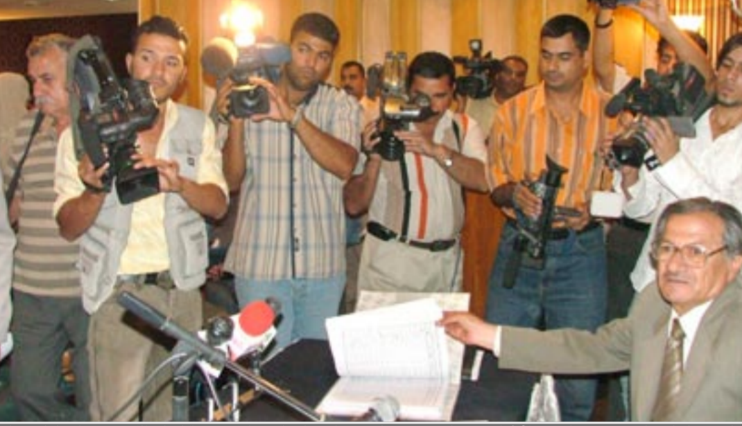
بیانیه بیش از یک میلیون شهروند عراقی، ۴۵۰۰ کیلومتر و حقوقدانان، ۶۶ حزب و انجمن سیاسی و اجتماعی برای تغییر بنده ۳ از ماده ۲۱ پیشنویس قانون اساسی عراق