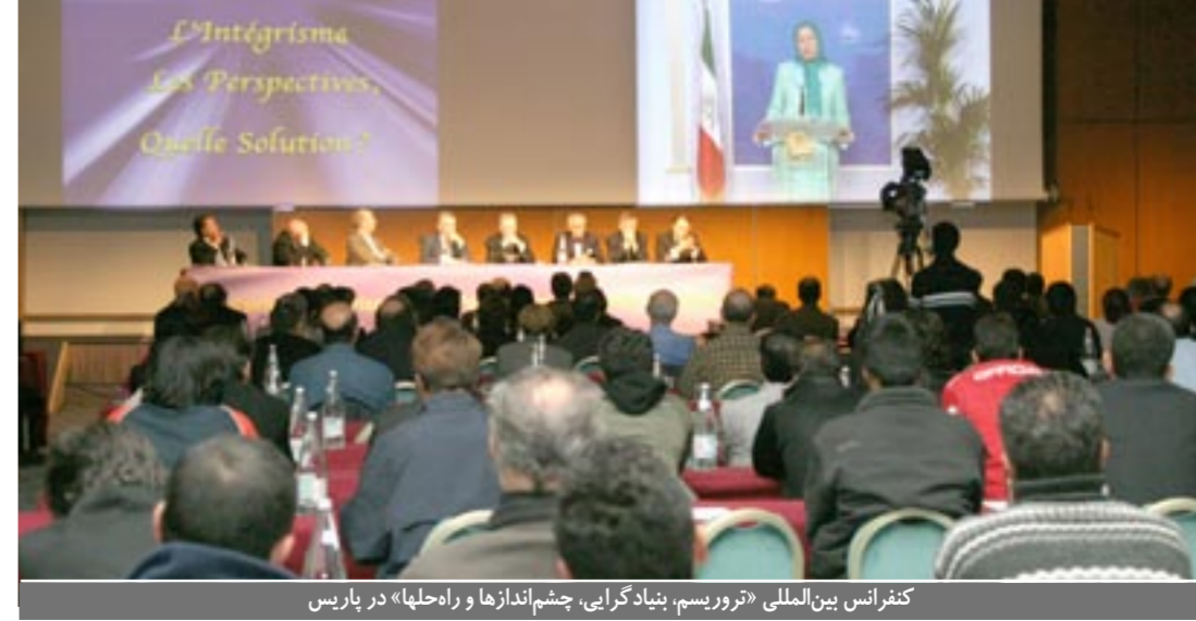
کنفرانس بین‌المللی «تروریسم، بنیادگرایی، چشم‌اندازها و راه‌حلهای» در پاریس