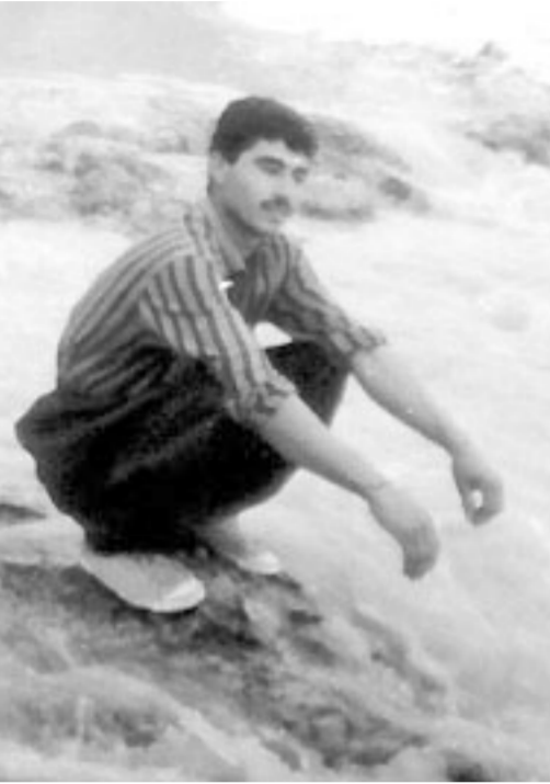
گل شیدای رنگ سید

هر ایرانی باشرف و باغیرت در مقابل این خون به‌ناحق‌ریخته شده مسئول است و با هر حرکت اعتراضی باید علیه رژیم به‌پا خاست و از شرکت در اعتراضات تا پیوستن به صفوف رزمندگان شهر شرف، در همهٔ زمینه‌ها رژیم را تحت فشار قرار داد. چرا که در این دوران رژیم در بدترین وضعیت می‌باشد و با هر تلاش و با هر ذره مایه گذاشتن روح حجت و حجتها را شاد و هرچه زودتر انتقام آنها را از رژیم پایه‌گور خمینی و اعوان و انصارش می‌گیریم.