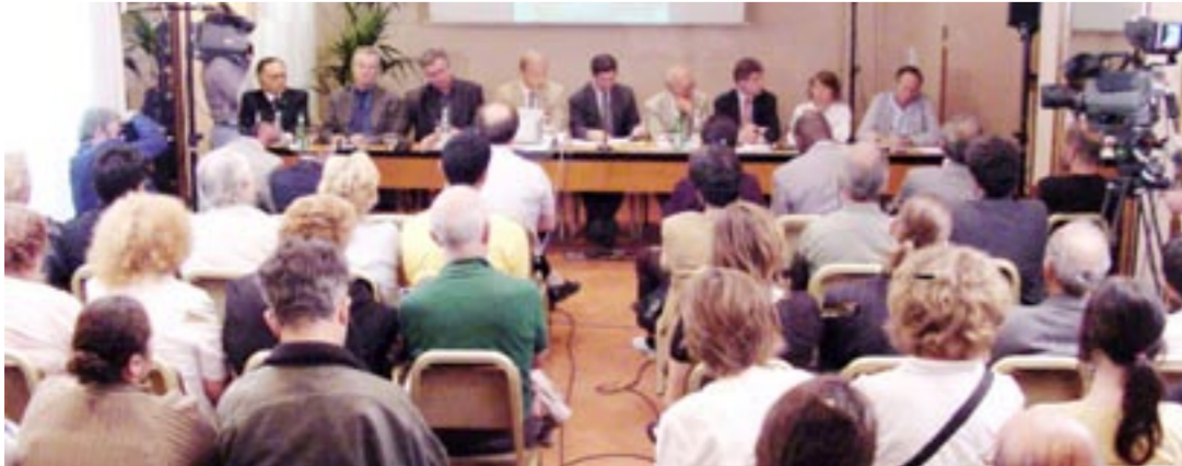
کنفرانس مطبوعاتی مقاومت ایران در پاریس برای آزادی دو مجاهد خلق ربوده شده در عراق

شخصیتهای سیاسی و روشنفکران دیالی و کرکوک در یک گردهمایی در اشرف خواستار دخالت نیروهای چند ملیتی برای آزادی دو مجاهد ربوده شده گشتند ۲۴مرداد - گردهماییهای هموطنان در شهرهای یوتوبوری، استکهلم، لاهه، تورنتو، لندن، نیویورک، هامبورگ و بن در اعتراض به ربوده شدن دو مجاهد خلق ۲۵مرداد - بزرگداشت خاطره زندانیان قتل عام شده در سال ۶۷ در شهر اورینو ایتالیا ۲۶مرداد - انتشار بیانیه اجلاس مشترک نیروهای دموکراتیک عراق، هیأت پارلمان اروپا و سازمان مجاهدین خلق ایران در پاریس برای آزادی دو مجاهد خلق ربوده شده در عراق ۲۷مرداد - برگزاری یک کنفرانس مطبوعاتی در لندن از سوی مقاومت ایران در مورد پروژههای اتمی و نقش سپاه پاسداران و وزارت دفاع رژیم آخوندی در آماده کردن هزاران دستگاه ساترفوژ ۲۸مرداد - کنفرانس مطبوعاتی هواداران مقاومت در شهر ترنولهیم (نروژ) ۲۸مرداد - جلسه «شی با مقاومت» در شهر آرهوس (دانمارک) در اعتراض به ربوده شدن دو مجاهد خلق در عراق ۲۸مرداد - کنفرانس مطبوعاتی مقاومت ایران در برلین در افشای تلاشهای رژیم برای سرکوبی آزادی و ساختن و انبار کردن ساترفوژها ۲۸مرداد - در کنفرانس شماری از انجمنها و سازمانها و شخصیتهای عراقی در اشرف شرکت کنندگان ضمن ابراز