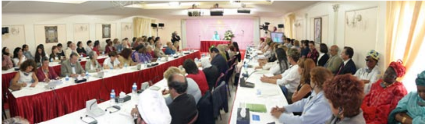
کنفرانس «اسلام، زنان و برابری» در محل اقامت رئیس جمهوری برزیل در برزیل

۱۷ شهریور - عشاير و شخصیتهای سیاسی و اجتماعی استانهای صلاح الدین و نینوا طی یک گردهمایی در اشرف خواستار اقدام دولت عراق برای آزادی دو مجاهد ربوده شده گشتند ۱۷ شهریور - افشای پروژههای اتمی رژیم آخوندی در مطبوعاتی در بروکسل و اسلو ۱۷ شهریور - تظاهرات هموطنان در لندن مقابل دفتر نخست وزیری در اعتراض به ربوده شدن دو مجاهد خلق در بغداد ۱۷ شهریور - در کنفرانس مطبوعاتی علیرضا جعفرزاده در واشینگتن فاش شد رژیم آخوندی به طرح موشکهای کروز باتوان حمل کلاهک هسته ای دست یافته است ۱۷ شهریور - در کنفرانس مطبوعاتی مقاومت ایران در ایتالیا طرحهای اتمی آنجمنها و نقش عوامل رژیم در ربودن دو مجاهد خلق در عراق افشا شد ۱۷ شهریور - کنفرانس «اسلام، زنان و برابری» در محل اقامت رئیس جمهوری برزیل در برزیل ۱۷ شهریور - در یک کنفرانس مطبوعاتی به ابتکار جمعیت ملی دفاع از حقوق بشر، در هتل قصرالعرب بغداد، بیانیه ۱۰۰۰۰ اوکیل و حقوقدان عراقی در محکومیت عمل چنانیکارانه ربودن دو مجاهد خلق انتشار یافت ۱۷ شهریور - کنفرانس مطبوعاتی «کمیته نیویورک علیه احمدی نژاد» در اعتراض به سفر احمدی نژاد به نیویورک