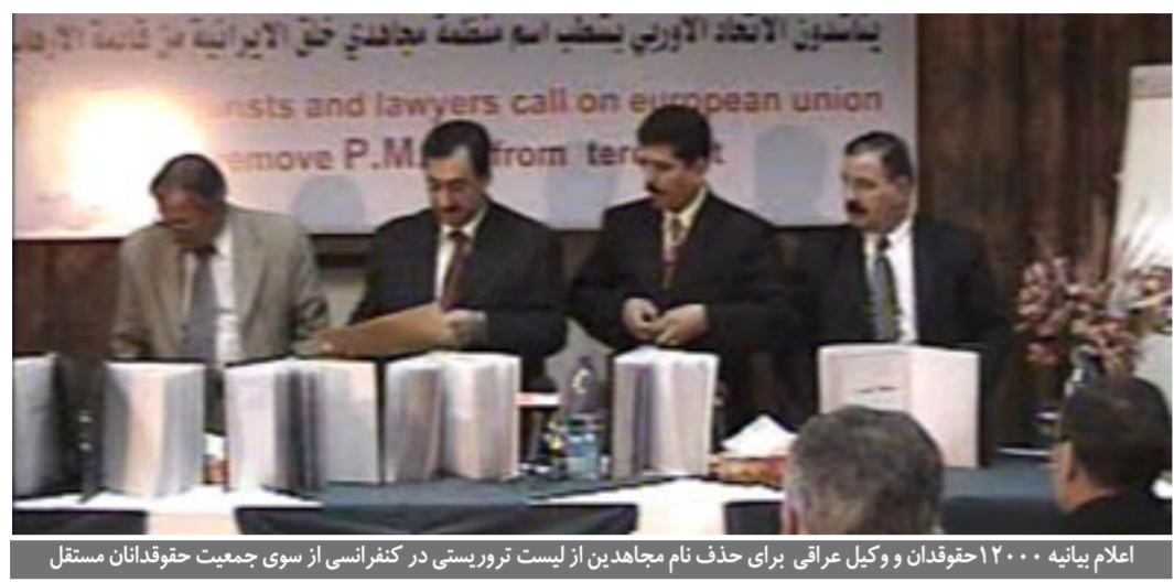
اعلام بیانیه ۱۲۰۰ حقوقدان و وکیل عراقی برای حذف نام مجاهدین از لیست تروریستی در کنفرانسی از سوی جمعیت حقوقدانان مستقل

۱۴ بهمن - طی یک کنفرانس در برلین ابتکار بیش از ۱۰۰۰ حقوقدان و وکیل برجسته و ۲۰۰ نماینده پارلمان از آلمان که خواستار حذف برچسب تروریستی از مجاهدین خلق شدند، اعلام گردید. ۱۴ بهمن - در یک کنفرانس در برلین ابتکار بیش از ۱۰۰۰ حقوقدان و وکیل برجسته و ۲۰۰ نماینده پارلمان از آلمان برای حذف نام مجاهدین از لیست تروریستی اعلام گردید. ۱۵ بهمن - تظاهرات ایرانیان در برابر کنفرانس امنیت مونیخ علیه برنامه های هسته ای رژیم آخوندی. ۱۵ بهمن - تظاهرات هواداران مقاومت در حمایت از اعمال تحریم علیه رژیم آخوندی توسط شورای امنیت، همزمان با اجلاس کنفرانس امنیت جهانی در مونیخ (آلمان). ۱۵ بهمن - تجمع اعتراضی ایرانیان آزاده در یوتیوبی (سوند) در همبستگی با رانندگان شرکت واحد اتوبوسرانی تهران. ۱۶ بهمن - دیدار برایان بیلی، نماینده مجلس انگلستان با خانم مریم رجوی رئیس‌جمهور برگزیده مقاومت در اورسوراواز. ۲۰ بهمن - در جلسه رسمی مجلس اعیان انگلستان نمایندگان خواستار خارج ساختن نام مجاهدین از لیست تروریستی شدند. ۲۰ بهمن - شرکت علیرضا جعفرزاده در سمینار دانشگاه آمریکن در واشینگتن با حضور سخنرانانی از جانب دولت آمریکا، متخصصان امنی و استادان دانشگاههای معروف آمریکا. ۲۱ بهمن - در جلسه هی که از سوی «کمیج» زنان علیه بنیادگرایی در ایران» در کلومب خیرنگاران آمریکا در شهر واشینگتن، برگزار شد، سیاست واشینگتن در خاورمیانه و نقش زنان در ایران و عراق بررسی گردید. ۲۲ بهمن - مراسم بزرگداشت شهادت مجاهد