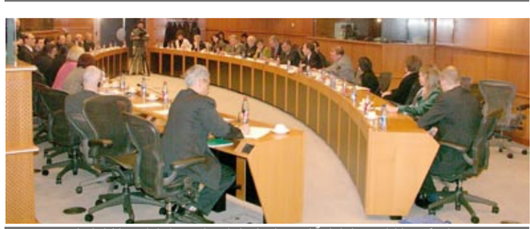
جلسه کمیته پارلمانی دوستان ایران از سازمان مجاهدین خلق ایران در پارلمان اروپا