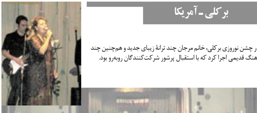
برکلی - آمریکا

در جشن نوروزی برکلی، خانم مرجان چند ترانه زیبای جدید و هم‌چنین چند آهنگ قدیمی اجرا کرد که با استقبال پرشور شرکت‌کنندگان روبه‌رو بود.