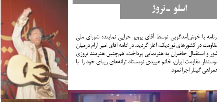
اسلو - نروژ