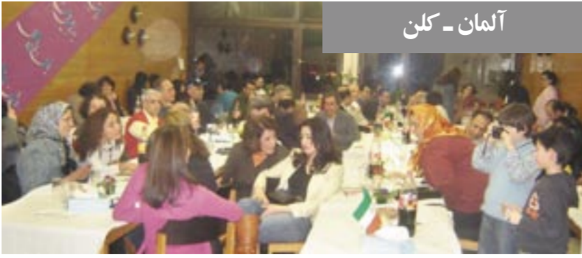
آلمان - کَلن

در مراسم نوروزی تورنتو، خانم سوزان کادیس نماینده پارلمان از حزب لیبرال به سخنرانی پرداخت و ضمن تبریک نوروز برای همه ایرانیان آرزوی دستیابی به دموکراسی نمود. سپس آقای بریان ویلفرت از حزب لیبرال سخنرانی ایراد کرد و آرزوی سالی پر بار و عاری از نقض حقوق بشر برای ایرانیان نمود. خانم یاسمین راتانسی نماینده پارلمان از حزب لیبرال نیز به سخنرانی پرداخت و با برشمردن ویژگیهای نوروز برای همه ایرانیان آرزوی سالی پر بار نمود. خانم راتانسی تأکید کرد: ما تلاش می‌کنیم تا حقوق بشر و دموکراسی به ایران بازگردد.