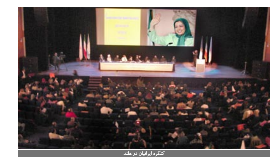
کنگره ایرانیان در هلند