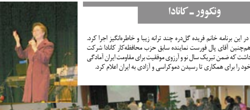
ونکوور - کانادا

به مناسبت فرارسیدن نوروز ۸۵، ایرانیان آزاده و حامیان مقاومت طی اولین روزهای سال جدید، در شهرهای مختلف اروپا و آمریکا، جشنهای بزرگی برگزار نمودند. در این برنامه‌ها سخنرانی نوروزی خانم مریم رجوی رئیس‌جمهور برگزیده مقاومت پخش گردید. سپس هنرمندان به اجرای برنامه‌های هنری پرداختند. شخصیت‌های سیاسی و فرهنگی که در مراسم شرکت داشتند، ضمن تبریک نوروز حمایت خود را از مقاومت ایران اعلام داشتند. در این صفحه تصاویرها و گزارش کوتاهی از این جشنها را ملاحظه می‌کنید.