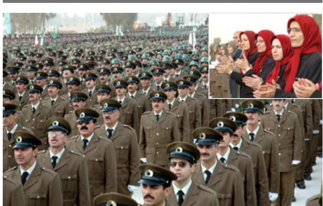
بزرگداشت شهیدان یکصدسال مبارزات مردم ایران در سالروز انقلاب ضدسلطنتی در اشرف