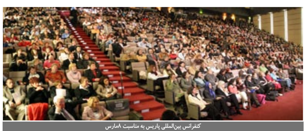
کنفرانس بین‌المللی پاریس به مناسبت ۸ مارس