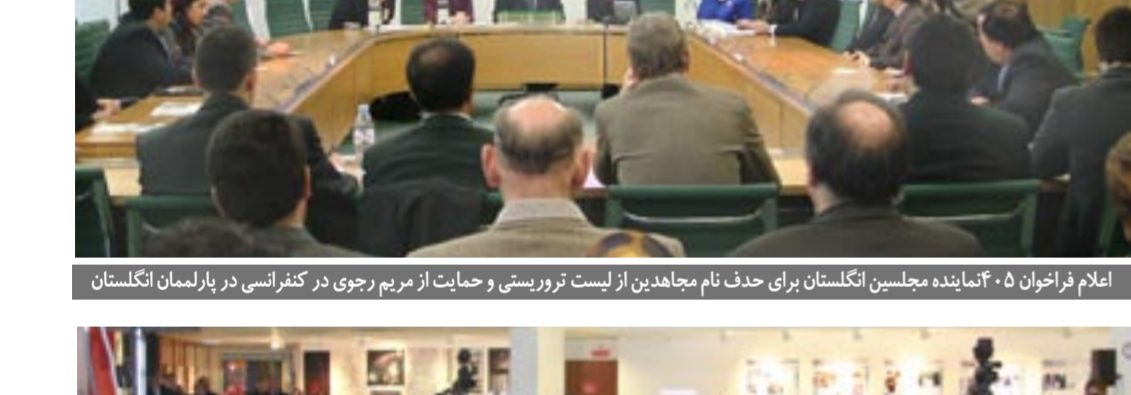
اعلام فراخوان ۴۰۵ نماینده مجلسین انگلستان برای حذف نام مجاهدین از لیست تروریستی و حمایت از مریم رجوی در پارلمان انگلستان