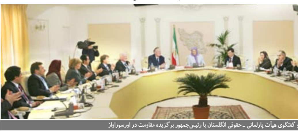
دیدار و گفتگوی هیأت پارلمانی - حقوقی انگلستان با رئیس‌جمهور برگزیده مقاومت در اورسوراواز

اسفند - کنفرانس بزرگ مطبوعاتی در پارلمان اروپا در اعتراض به حضور متکی، وزیر خارجه جنایتکار رژیم، توسط گروه دوستان ایران آزاد و با حضور نایب‌رئیس پارلمان اروپا برگزار گردید ۳ اسفند - به ابتکار کمیته پارلمانی دوستان ایران آزاد در پارلمان اروپا، جلسه‌یی در همبستگی با مقاومت ایران تحت‌عنوان «احمدی‌نژاد و راه‌حلهای اروپا» در مقر این پارلمان در بروکسل برگزار گردید. در این جلسه که با رایحه مشترک پانول کاسا کا نماینده پارلمان اروپا از پرتغال و استوان استیونسون، نایب رئیس گروه دموکرات مسیحی پارلمان برگزار گردید، تونه کلا، نماینده پارلمان اروپا از استونی و عضو هیات رئیسه گروه دموکرات مسیحی - محافظه کار، اوا بریت سونسون، نایب رئیس کمیسیون زنان پارلمان اروپا از سوئد، کارین رستارتینس، نماینده اتریشی پارلمان از گروه لیبرال، موگنز کامره نایب رئیس گروه اتحاد اروپا برای ملتها یونان، نماینده پارلمان اروپا از پرتغال و یو.ای. آن فریبا، نماینده فرانسوی از گروه سوسیالیست، سخرانی کردند ۳ اسفند - گرامیداشت یاد و خاطره مجاهد شهید حاجت زمانی در گردهمایی ایرانیان و فرانسویان در پاریس ۲ و ۳ اسفند - تجمع هوپندان برای