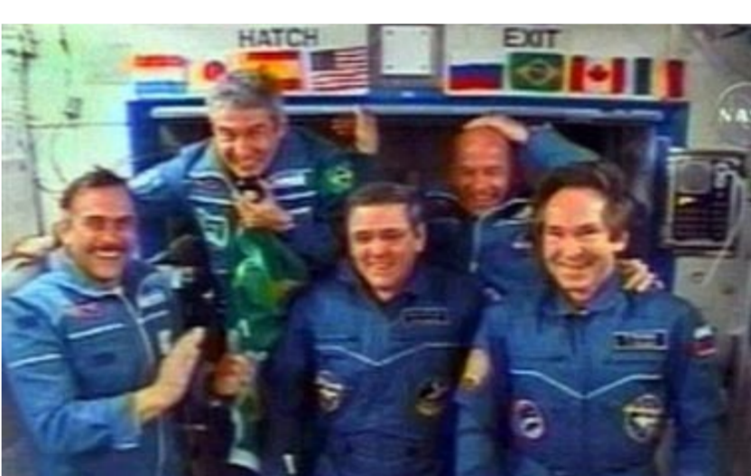
خدمه ایستگاه فضایی بین‌المللی به خدمه جدید که وارد ایستگاه فضایی شده‌اند. خوشامد می‌گویند

حدود یک ساعت و نیم بعد از این که سایوز به ایستگاه فضایی متصل شد، درپها باز شد و ویلیامز، وینوگرادف و پونتس به داخل ایستگاه فضایی بین‌المللی وارد شدند. آنها پس از ورود با فضانورد روسی واری توکاروف و فضانورد آمریکایی بیل