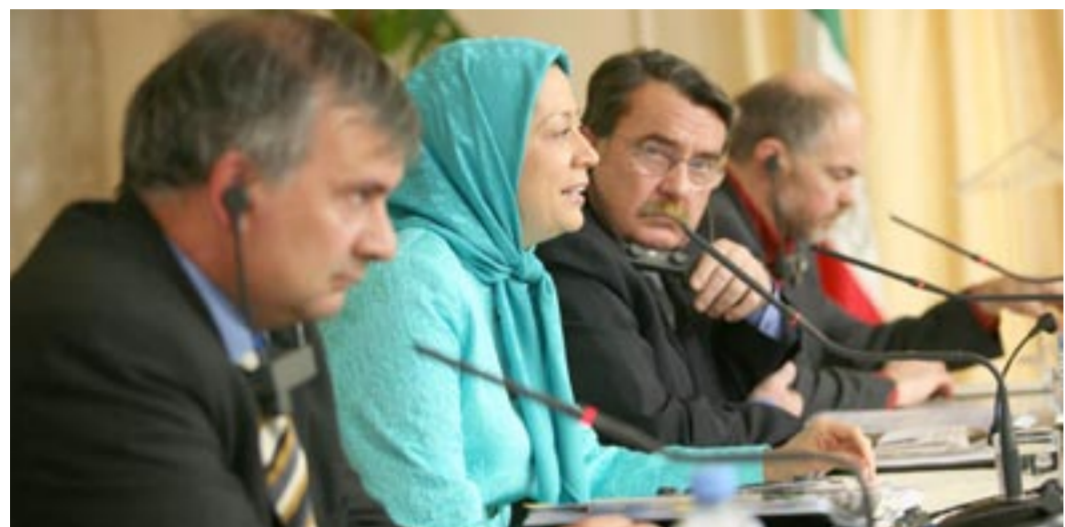
جلسه مطبوعاتی رئیس‌جمهور برگزیده مقاومت در اورسوراواز