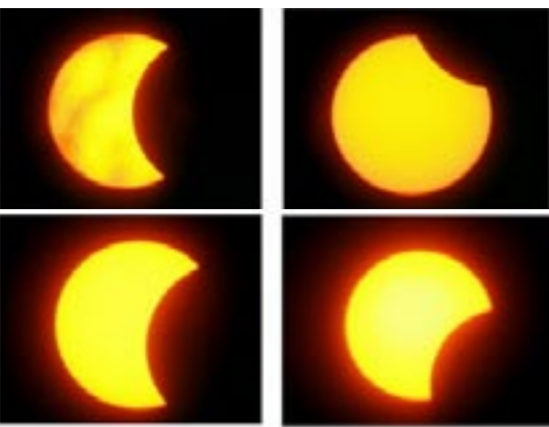
تصویری کسوف ناکامل خورشید که در ترکیه مشاهده گردید

کامل بعدی در روز اول اول سال ۲۰۰۸ در بخشهایی از آمریکای شمالی، اروپا و آسیایوری خواهد داد. آخرین کسوف کامل در روز ۲۳نوامبر ۲۰۰۳ روی داد اما تنها از بخش ی از قطب جنوب قابل مشاهده بود.