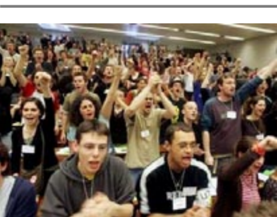
دانشجویان فرانسوی به ادامه اعتصاب و تظاهرات علیه قانون کار جدید رأی می‌دهند

در کشورهای مختلف هشدار داده شد که کودکان در صورت نظارت مستقیم خورشید در جریان کسوف ناکامل با خطر لطمه‌شدیده به فوه بینایی و حتی خطر کوری مواجه خواهند بود. بدین ترتیب تماشای مستقیم خورشید به وسیله فیلترهای ویژه خورشیدی صورت گرفت.