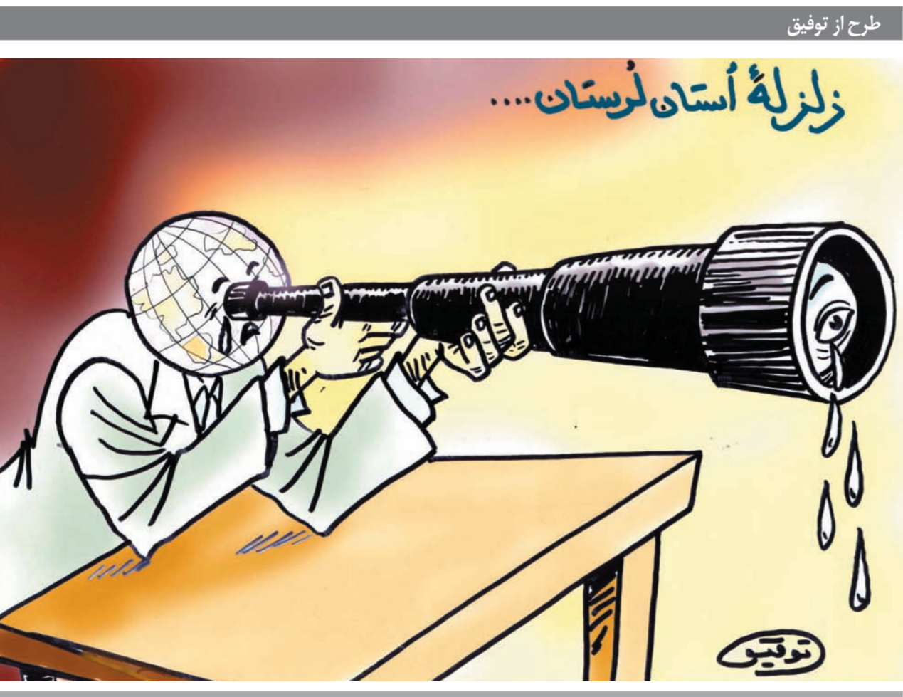
زلزلهٔ استان لرستان.....

در این دیدار علاوه بر لرد کوربت، لرد راسل جاستون، رئیس سابق مجمع پارلمانی شورای اروپا، پاولوس هریس از ریچموند، از معاونین حزب لیبرال دموکرات در مجلس لردها، آقایان آندرو مکینلی، عضو کمیته خارجی پارلمان انگلستان، دیوید ایبسن نماینده پارلمان، استفن گروس، حقوقدان برجسته، مارک مولو، رئیس کمیته حقوق‌بشر کانون و کلاو مالکوم فالور، عضو کمیته بین‌المللی حقوق‌بشر