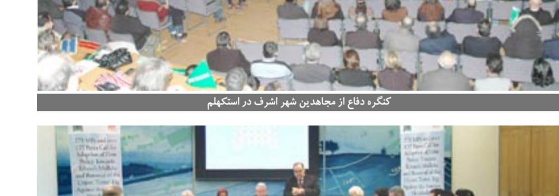
کنگره دفاع از مجاهدین شهر اشرف در استکهلم