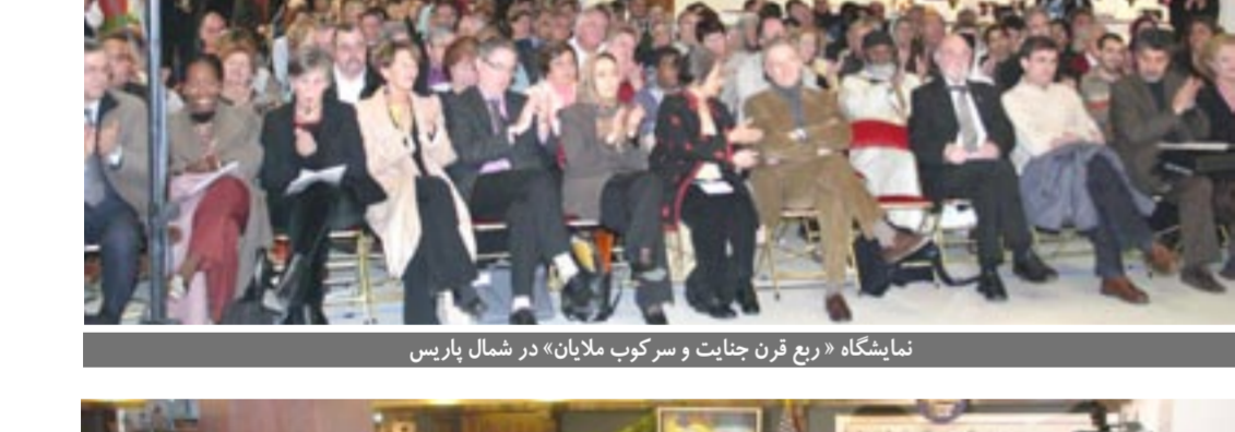
نمایشگاه «ربع قرن جنایت و سرکوب ملایان» در شمال پاریس