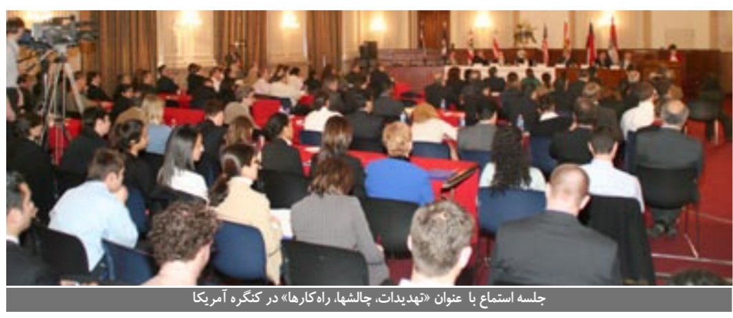
جلسه استماع با عنوان «تهدیدات، چالشها، راه‌کارها» در کنگره آمریکا

چند استان عراق، هم‌چنین گردهمایی شخصیتهای سیاسی از استانهای مختلف عراق در «اشرف»، جنایت هولناک انفجار مرقد مطهر امامان دهم و یازدهم در سامرا و تهاجمهای گسترده به مساجد اهل تسنن محکوم گردید. - تظاهرات ایرانیان آزاده مقیم سوند در مقابل پارلمان این کشور در حمایت از «راه‌حل سوم» - گردهمایی ۲۰۰ تن از شخصیتهای سیاسی، حقوقدانان و شیوخ عراقی در سالگرد ۱۹ بهمن، عاشورای مجاهدین در اشرف - نصب پوستر و شعارنویسی توسط جوانان انقلابی در سطح گسترده‌یی در داخل میهن به مناسبت بزرگداشت شهیدان ۱۹ بهمن گردهماییها و تجمعات مردم عراق علیه دخالتهای رژیم آخوندی در عراق - گردهمایی زنان استان دیالی - اجتماع شیوخ عشایر و شخصیتهای سیاسی و دانشجویان در منطقه بلدروز - گردهمایی شیوخ عشایر و شخصیتهای سیاسی استان دیالی - گردهمایی شهروندان و شیوخ عشایر استان صلاح‌الدین - مراسم بزرگداشت شهادت مجاهد قهرمان حاجت زمانی در «اشرف» - تجمع هوپندان در هامبورگ (آلمان) به مناسبت بیست‌و هفتمین سالگرد انقلاب ۲۲ بهمن مراسم بزرگداشت ۱۹ بهمن در ۲۱ شهر جهان در شهرهای مختلف اروپا، آمریکا و استرالیا در شهرهای اورینو و رم (ایتالیا)، استکهلم بروکسل (بلژیک)، واشینگتن، برکلی، دالاس و لس آنجلس (آمریکا)، اسول (ترکز)، ونکوور، اتاوا و تورنتو (کانادا)، کلن (آلمان)، پاریس (فرانسه)، لندن (انگلستان)، لاهه (هلند) (سیدنی) (استرالیا)، زوریخ (سوئیس)