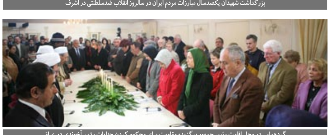
گردهمایی در محل اقامت رئیس‌جمهور برگزیده مقاومت برای محکوم کردن جنایات رژیم آخوندی در عراق