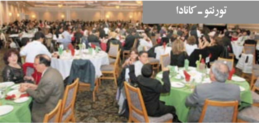
تورنتو - کانادا

در مراسم نوروزی تورنتو، خانم سوزان کادیس نماینده پارلمان از حزب لیبرال به سخنرانی پرداخت و ضمن تبریک نوروز برای همه ایرانیان آرزوی دستیابی به دموکراسی نمود. سپس آقای بریان ویلفرت از حزب لیبرال سخنرانی ایراد کرد و آرزوی سالی پر بار و عاری از نقض حقوق بشر برای ایرانیان نمود. خانم یاسمین راتانسی نماینده پارلمان از حزب لیبرال نیز به سخنرانی پرداخت و با برشمردن ویژگیهای نوروز برای همه ایرانیان آرزوی سالی پر بار نمود. خانم راتانسی تأکید کرد: ما تلاش می‌کنیم تا حقوق بشر و دموکراسی به ایران بازگردد.