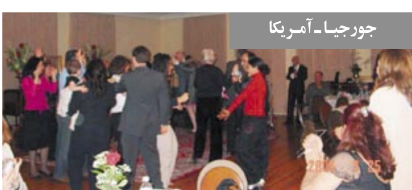
جورجیا - آمریکا