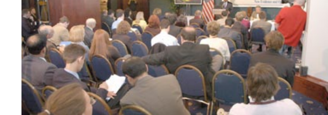
کنفرانس افشاگرانه در واشینگتن در مورد طرح‌های اتمی رژیم و آماده کردن ۵ هزار ساتریفوز در طنز