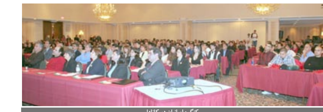
کنگره ایرانیان در کانادا