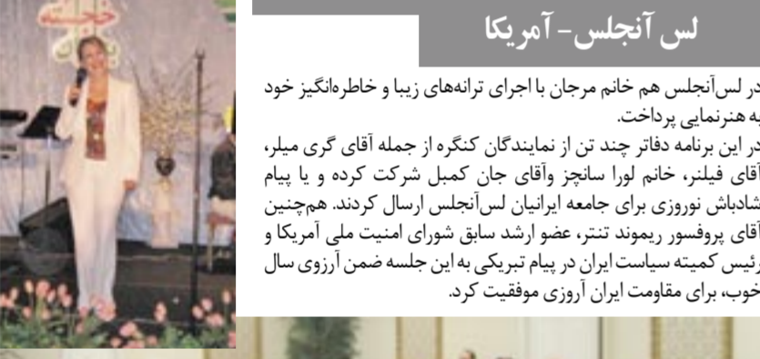
لس آنجلس - آمریکا