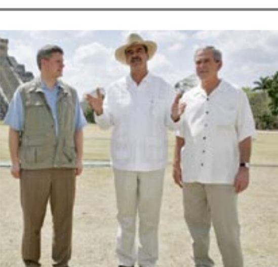
جرج بوش، رئیس‌جمهور آمریکا و ونسنته فاکس، رئیس‌جمهور مکزیک و استفان هارپر، نخست‌وزیر کانادا به اجلاس دو روزه خود در مکزیک خاتمه دادند

در طی روزهای شبیه و یکشنبه تظاهرات پراکنده‌یی در فرانسه به وقوع پیوست اما پلیس گفت در مقایسه با هفته گذشته وضعیت نسبتاً آرام بوده است. دانشجویانی که در هفته گذشته به بلوکه کردن ایستگاههای مهم قطار و تصرف ساختمانهای دولتی اقدام کرده بودند تصمیم خود را برای انجام اقدامات مشابه در روزهای آینده اعلام کرده‌اند.