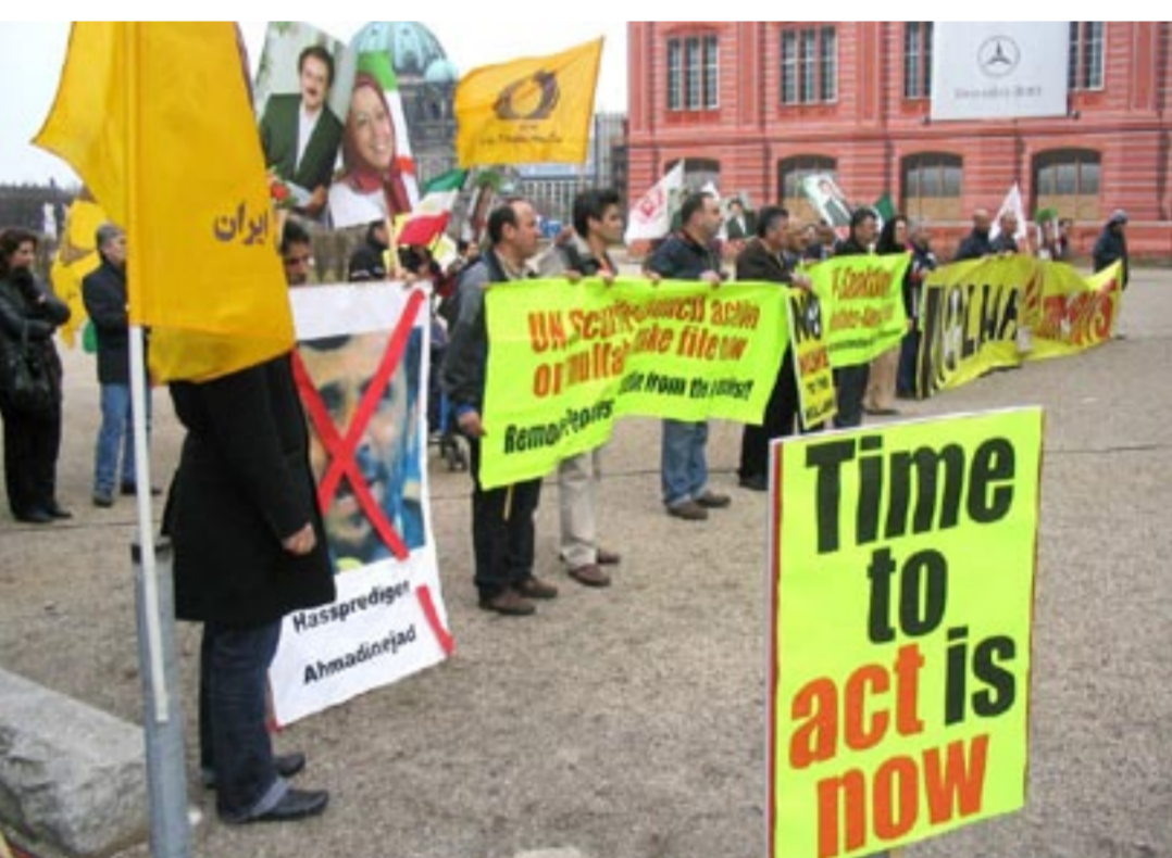
خبرگزاری رویتر ۱۰ فروردین (۳۰ مارس ۲۰۰۶) یک مرد ایرانی در برلین علیه سیاست هسته ای ایران تظاهرات می کند. ۶ قدرت جهانی در روز پنجشنبه در برلین گرد هم آمده اند تا در مورد گام بعدی در رابطه با ایران بحث و گفتگو کنند. خبرگزاری فرانسه - ۱۰ فروردین (۳۰ مارس ۲۰۰۶) در حالی که دولت های بزرگ جهان در برلین گرد هم آمده اند، حامیان اپوزیسیون ایرانی در مقابل وزارت خارجه آلمان در برلین تظاهرات برگزار کردند.

تظاهرات اعتراضی ایرانیان هوادار مقاومت با استقبال و همبستگی شهروندان آلمانی همراه بود و آنها با اعلام حمایت خود از این تظاهرات بر جدیت و ضرورت یافتن راه حلی قاطع برای مقابله با رژیم آخوندی تأکید کردند.