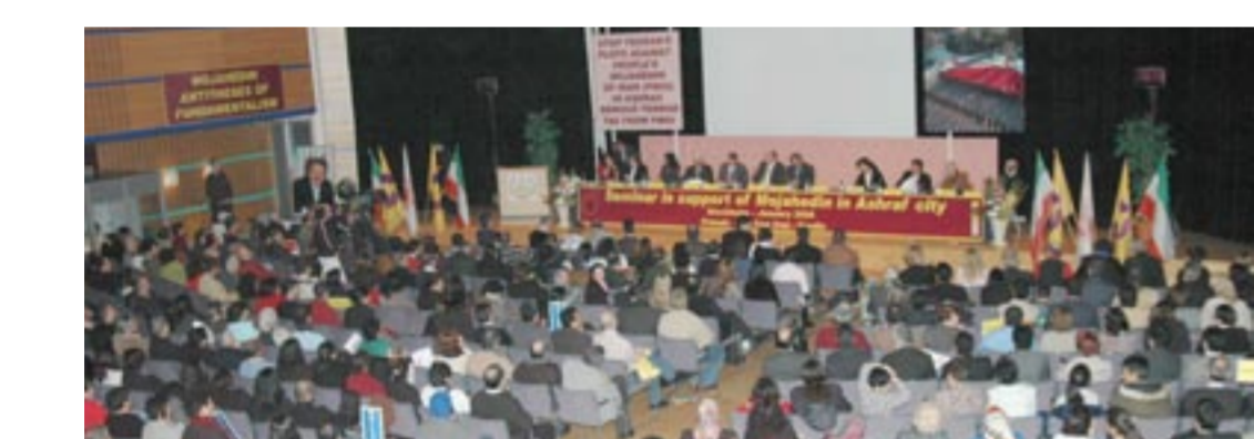
کنگره ایرانیان در کانادا