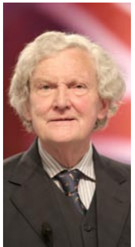
قاضی سابق دیوان عدالت اروپا

وقتی شورای وزیران سازمان مجاهدین را ممنوع کرد هیچ مدرک و شواهد متقنی برای اثبات مسأله تروریسم مطرح نکرد. پس مادامی که نتوانستند چیزی را اثبات کنند حق ندارند که آنها را در لیست قرار بدهند