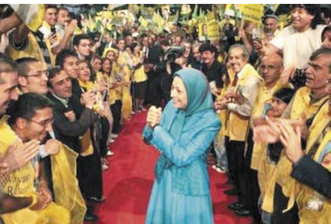
مریم رجوی رئیس‌جمهور منتخب شورای ملی مقاومت ایران، توسط هواداران سازمان مجاهدین خلق ایران که در گردهمایی از سراسر اروپا در تالار ویلپینت در نزدیکی پاریس گردهم آمدند، بودند، با کف زدن مورد استقبال قرار می‌گیرد.

ایرانیها از سراسر اروپا در پاریس تجمع کردند تا علیه رژیم ایران اعتراض کنند. آنها خواهان تغییرات دموکراتیک در کشور خودشان شدند.