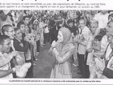
خود را در ستادشان در خیابان گر در اور جشن گرفتند. یک گردهمایی بزرگ ترتیب داده شده بود تا تصمیم دادگاه عدالت اروپا جشن گرفته شود. روز ۱۲ دسامبر، این دادگاه در عمل تصمیم مربوط به سال ۲۰۰۲ را که مجاهدین خلق ایران را در لیست سازمانهای تروریستی قرار داده بود لغو کرد. دادگاه در حکم خود می گوید تصمیم اتخاذ شده توسط اتحادیه اروپا در قبال مجاهدین «ناقض حق دفاع، اجبار ارانه دلیل، و حق برخورداری از حفاظت حقوقی مؤثر» می باشد. این حکم هم چنین ملغی شدن تصمیم شورای اروپا برای منجمد کردن داراییهای سازمان مقاومت کنندگان ایرانی را به دنبال داشت.

مریم رجوی افزود: امروز ۳۰ ژانویه، شورای وزیران اتحادیه اروپا اعلام کرد قصد ابقای نامگذاری را دارد. در عین حال از مقاومت ایران خواست که دلالت خود را برای رد اتهام ارانه کند و یک ماه مهلت قائل شد. درحالی که تصمیم به نگهداری نام مجاهدین در لیست، قانون شکنی بود و درخواست مدارک، یک نقاب آشکارا.