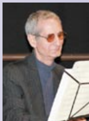
آهنگ: آندرانیک شعر: شمس

سرود صبح پیروزی برای میهن ایران شروع فتح هر میدان رسیده ست لفظه توفان