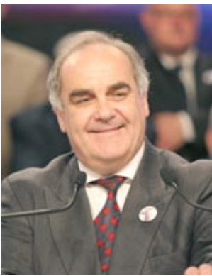
دوستان عزیز اجازه بدهید که از این برنامه با انرژی چند برابر بیرون برویم و تضمین بکنیم فرصت بعد که همدیگر را دیدیم در تهران باشد. درود بر شما.

مجاهدین اقدام قضایی کرده ایم و شکایت کرده ایم و معتقدیم این یک اقدام ناعادانه است. ما می گویم این یک اشتباه بزرگ است و می خواهیم پیامی به رژیم تهران بفرستیم و به رژیم ایران بگویم که روزهای شما به شمارش افتاده و زمان آن رسیده که اتحادیه اروپا دوستان واقعی خودش را برای دموکراسی و آزادی به رسمیت بشناسد. من و برابان بینلی و دیگر اعضای هیأت انگلیسی و همه پارلمانتها در جهان آزاد می گویم که مفتخریم که در این گردهمایی برای یادآوری یک حادثه بسیار شوم