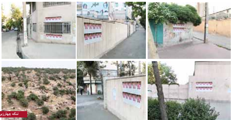
تنگه چهارزبر - مرداد ۸۶