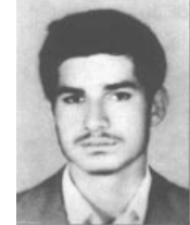
مجاهد شهید مهدی محمدنواز