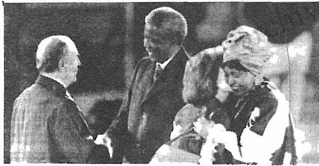
ماندلا در آغاز سفر جهانی خود در بیاریس ۹ در صفحه ۱