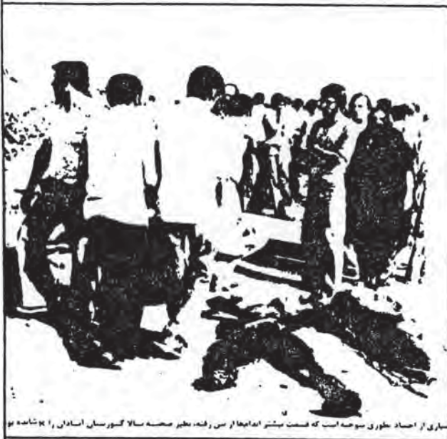
سرای از احداث بطوری سوخته است که قسمت بیشتر آنجا را سر رفته، بطور صحنه سالانگی گورستان امداد را نشان داده بود

ج- خیر، ما به همه جا بلکراف کردیم، به بنی صدر به