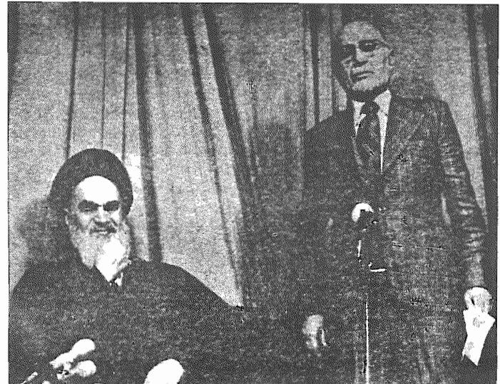
دولت موقت که محصول بازرگانها، بهشتی‌ها و هوپوز آمریکا می بود تشکیل میشود

همراه با نامه‌ای به امای قطب راه وسید علی خامنه‌ای - با قید خیلی فوری - برای "نهضت آزادی بخش انقلاب اسلامی افغانستان"، انصاف شماره ۴۰۲۲۵ با بانک مرکزی به حواله گردید. قربانعلی محقق در قلم در میبندد (کا ۵۴)