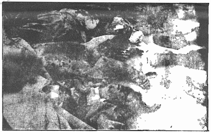
کشتار رژیم جمهوری اسلامی در کردستان "این سند جنایت ارتجاع"