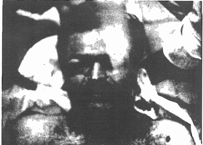
رفیق شهید محمدتقی شهرام بجرم کمونیست بودن بشهادت رسید، "جرمی" که باید بدان افتخار کرد و تاپای جان در راه آن ایستاد.