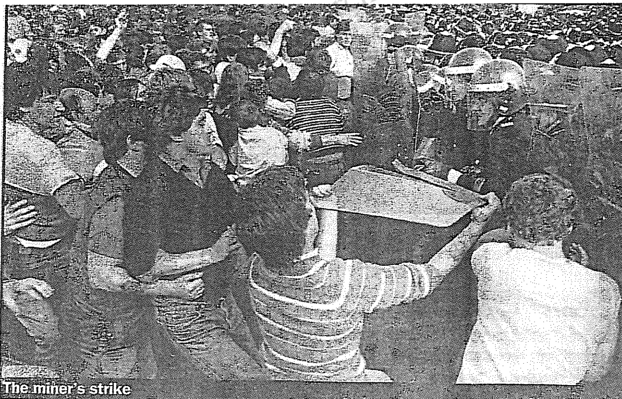
The miner's strike

سرکوب اعتصاب معدنچیان بریتانیا، جلوه‌ای از دمراسی غربی